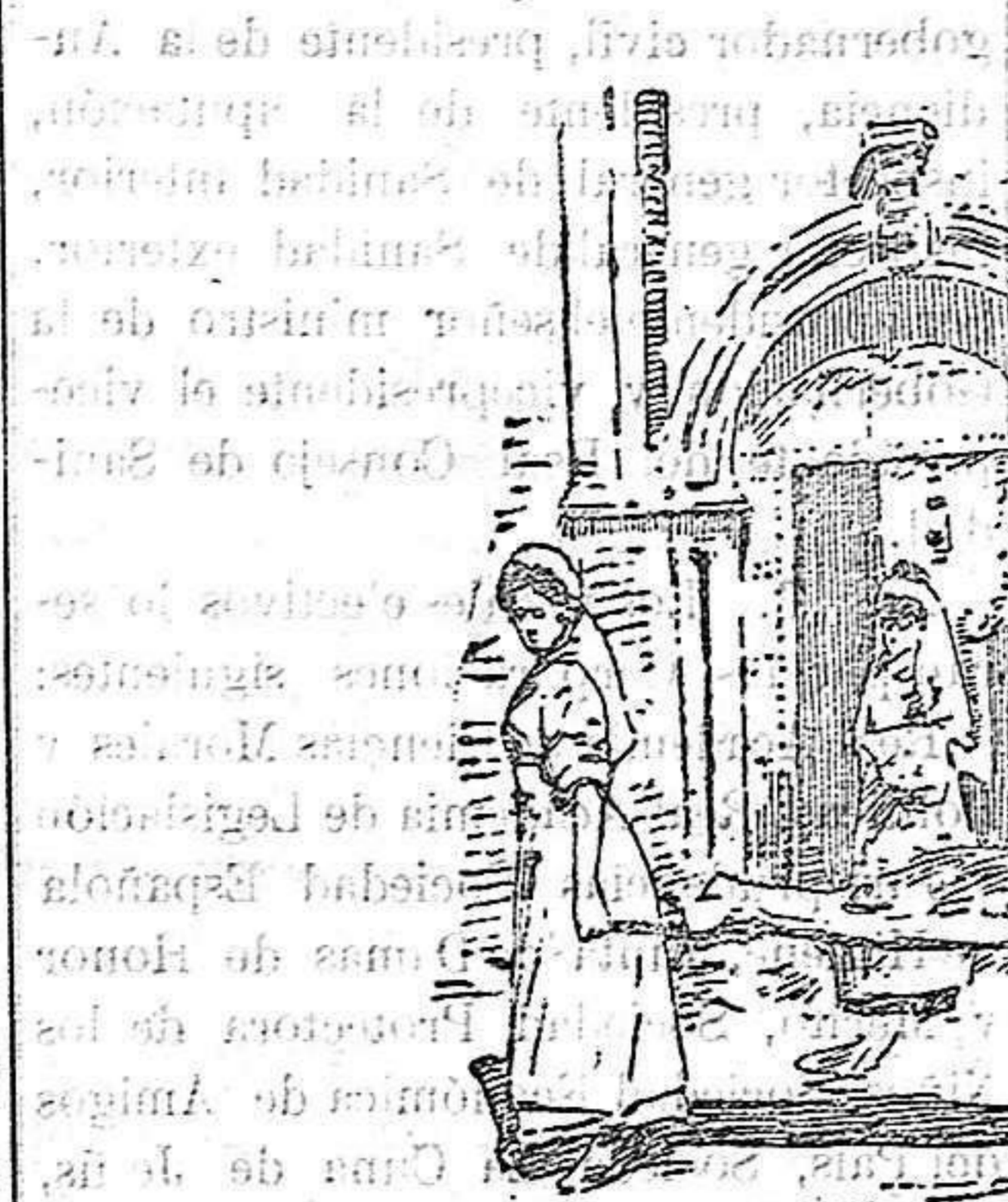
El transporte de heridos en Casablanca

Esta es en realidad la primera campaña en que toman parte las enfermeras francesas, y según dicen los periódicos de la vecina república y han manifestado así los generales Drude y Amade, su cooperación es interesantísima y digna de tenerse en cuenta.