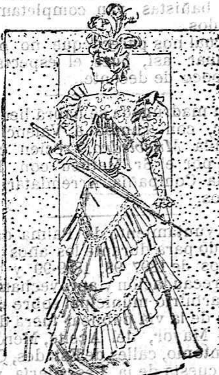
Traje para carreras

Forma princesa. De bengalina moaré, color paja, y guipur sobre transparente de raso blanco. Cuerpo escotado, también de raso blanco, cubierto de guipur en el delantero izquierdo y abrochado con dos botones, dejando ver una quilla de guipur en la falda. Mangas cortas en forma de globo, adornadas con dos volantes plegados.