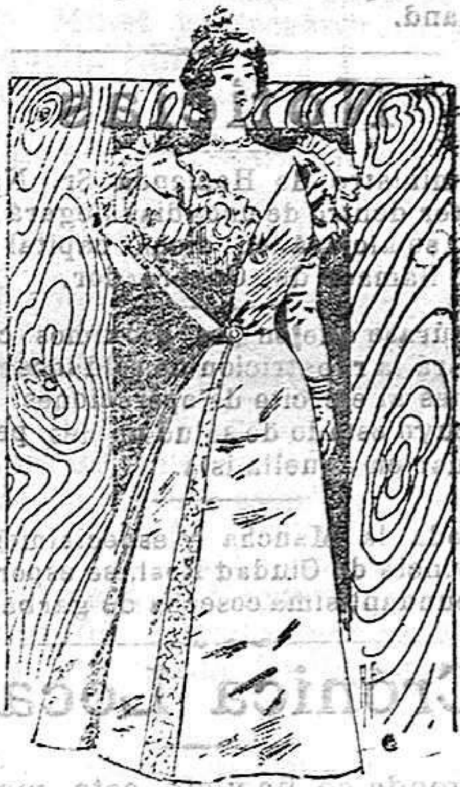
Traje para verano

De glasé rosa salmón. Cuerpo ajustado, de raso blanco, cubierto con tiras de glasé rosa, adornadas con ruxa de gasa plegada acordeón, con betones al lado; colocados sobre un cinturón de terciopelo miróir ; cuello también de terciopelo y mangas al biés. La falda medio acampaña.