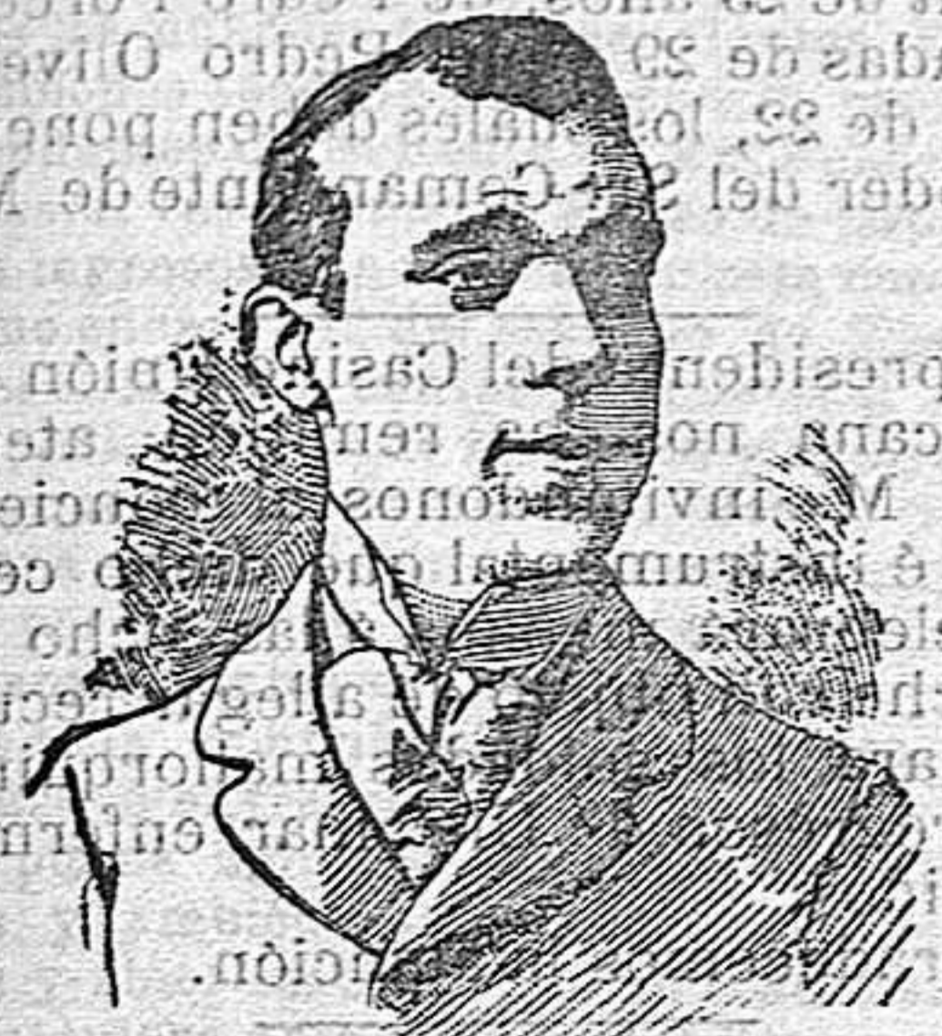
FERNANDO DIAZ DE MENDOZA