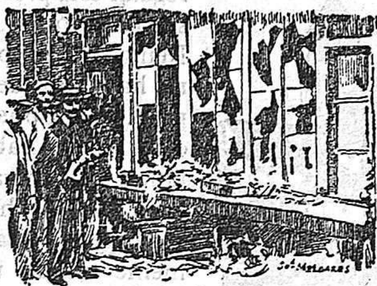
ASPECTO DEL TALLER DESPUES DE LA EXPLOSION