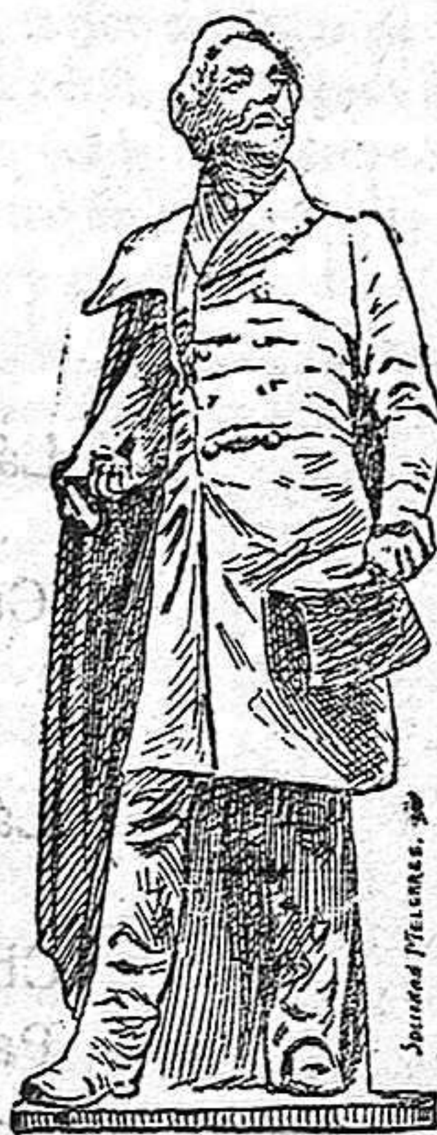
Estátua erigida á Alfredo de Musset en Neuilly (Paris).