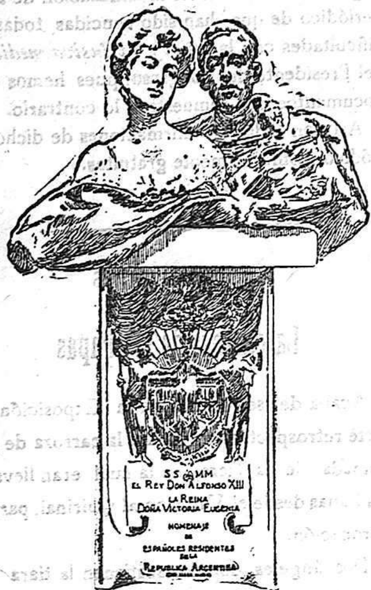
Grupo escultórico de SS. MM.

El bronce y el mármol, son los materiales que han entrada en la confección de esta obra, y del efecto que su contemplación produce, hacen entusiastas elogios cuantos tuvieron la fortuna de verla antes de ser entregada a SS. MM.