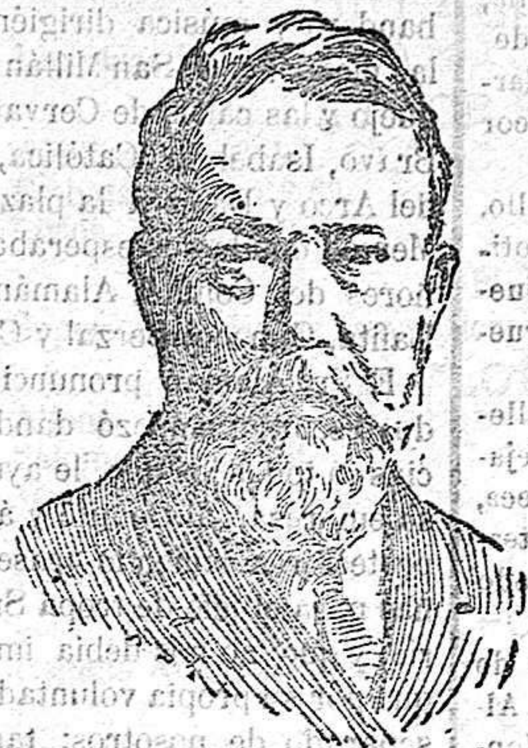
El ilustre pintor D. Joaquín Sorolla, elegido por unanimidad académico de número de la Real Academia de San Fernando.