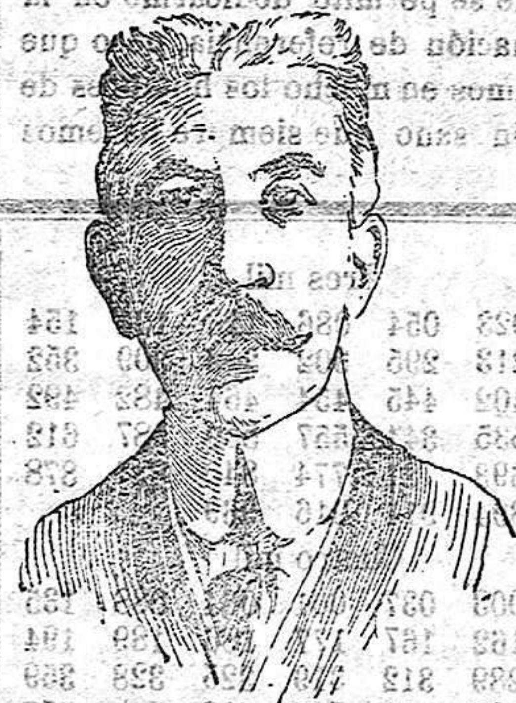
Portrait of a man, likely the author or a key figure mentioned in the text.