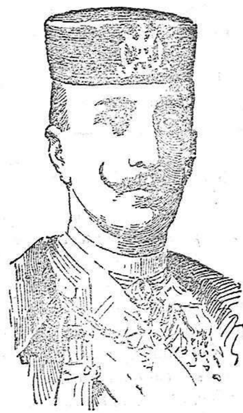
DE LA GUERRA TURCO BALKANICA

Nosotros nos congratularemos de que el Ayuntamiento encuentre medios de cumplir con esta atención, teniendo en cuenta la importancia grande que encierra para Segovia la visita de los congresistas del turismo.