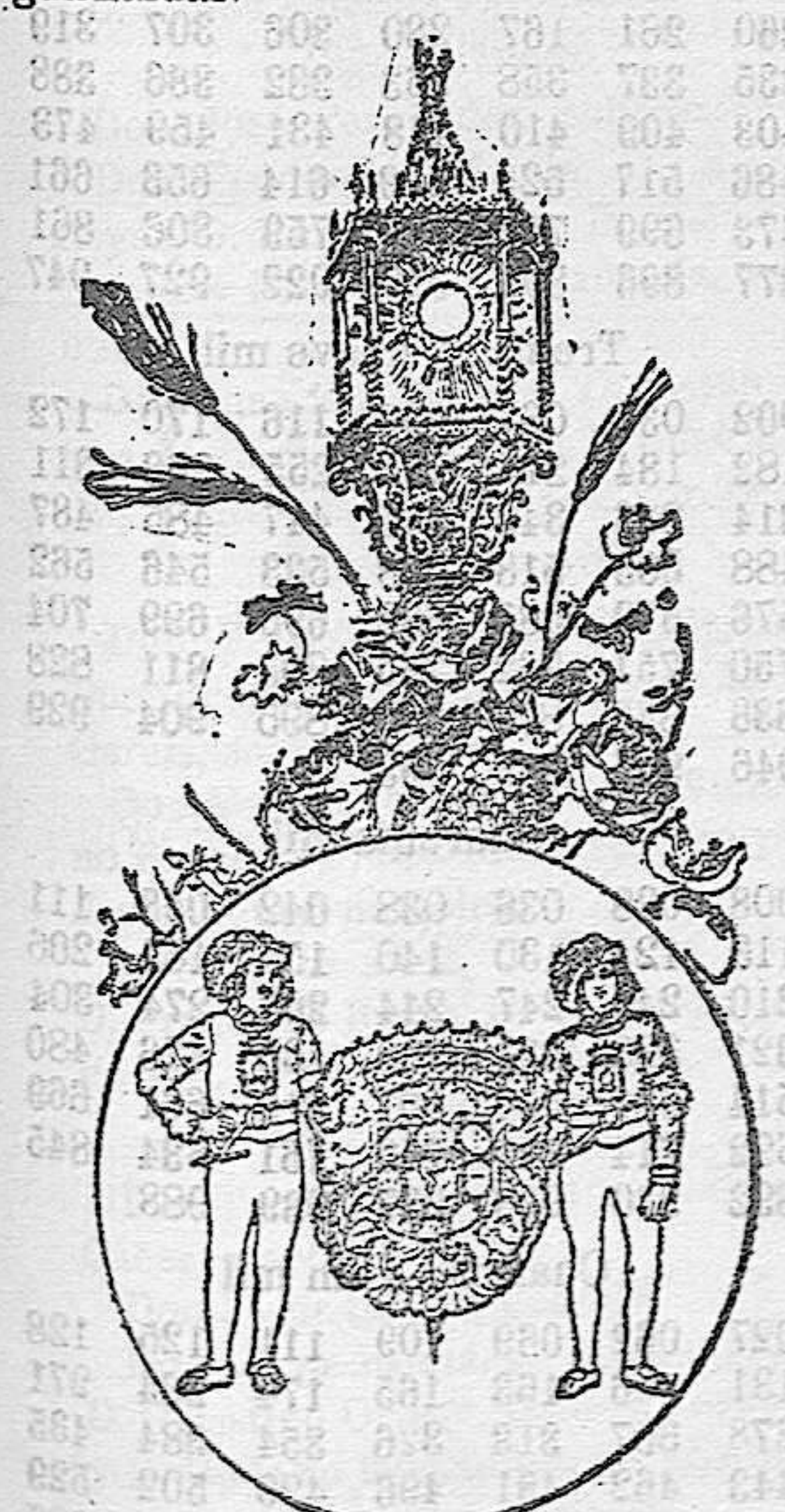
LA SAGRADA CUSTODIA que sale en la procesión. El histórico escudo de los Reyes Católicos y los pajes que lo conducen en la procesión.

No es el Corpus granadino festividad donde la algazara y las risas, las canciones y el júbilo tengan notas chilonas: Una poesía placida, blanda y tranquila como la de una balada, dulce como las aguas del aurífero Darro que suavemente se deslizan para besar los pies de aquella por quien suspiró el moro, serena y encantadora cual mística ofrenda de virgen purísima, envuelve aquellas fiestas, en cuyo primer término aparece la Santísima Custodia, que brillando á los rayos del sol, que parecen postrarse para besarla, teniendo por fondo calles melancólicas y de sugestiva poesía, ahora alegradas por el mujeriego que compite en belleza con las rosas, madre selvas y jazmines que en balcones y rejas entretejen sus multicolores y perfumadas guirnaldas.