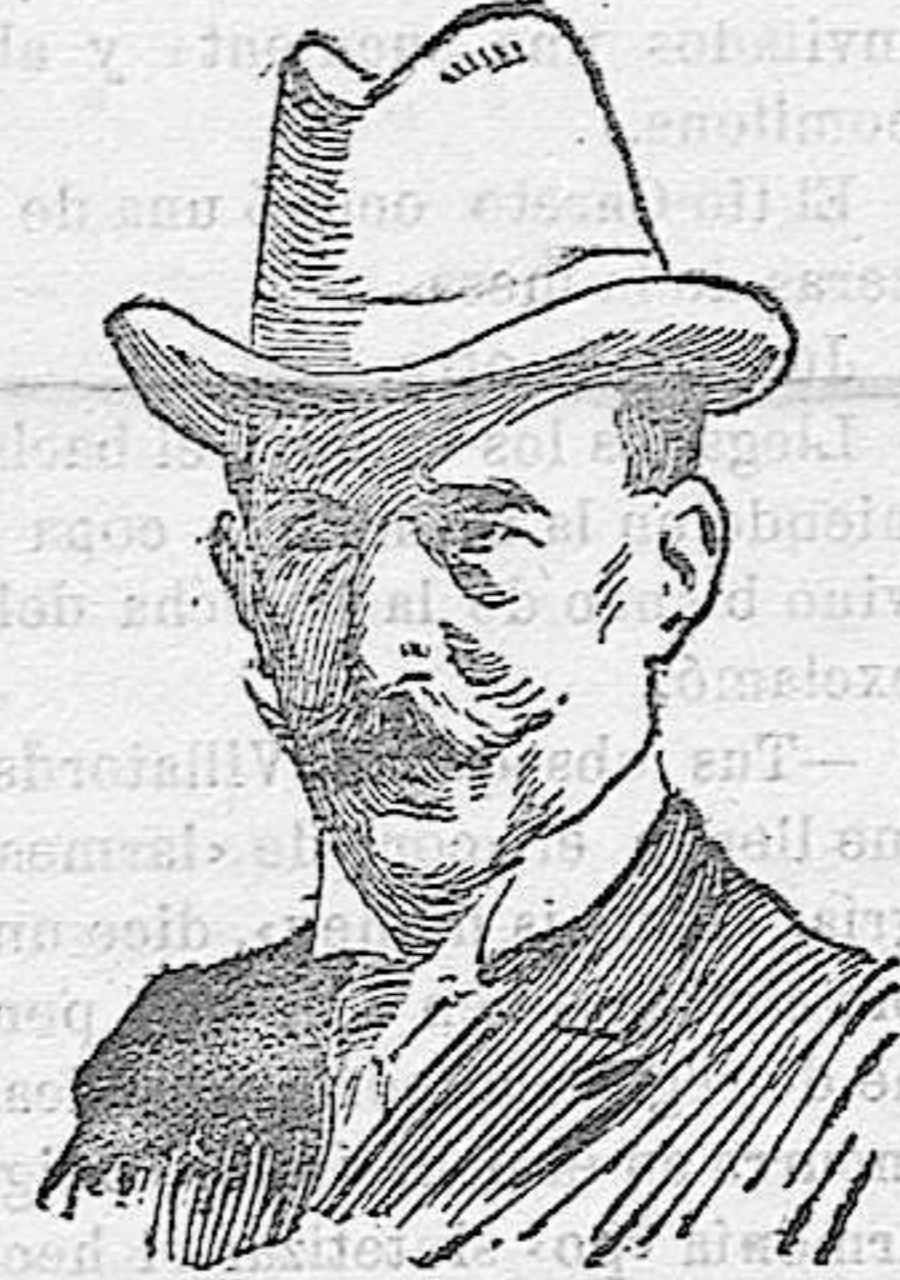
Constantino I, nuevo rey de Grecia

Afortunadamente, su estado, aunque grave, no es desesperado.