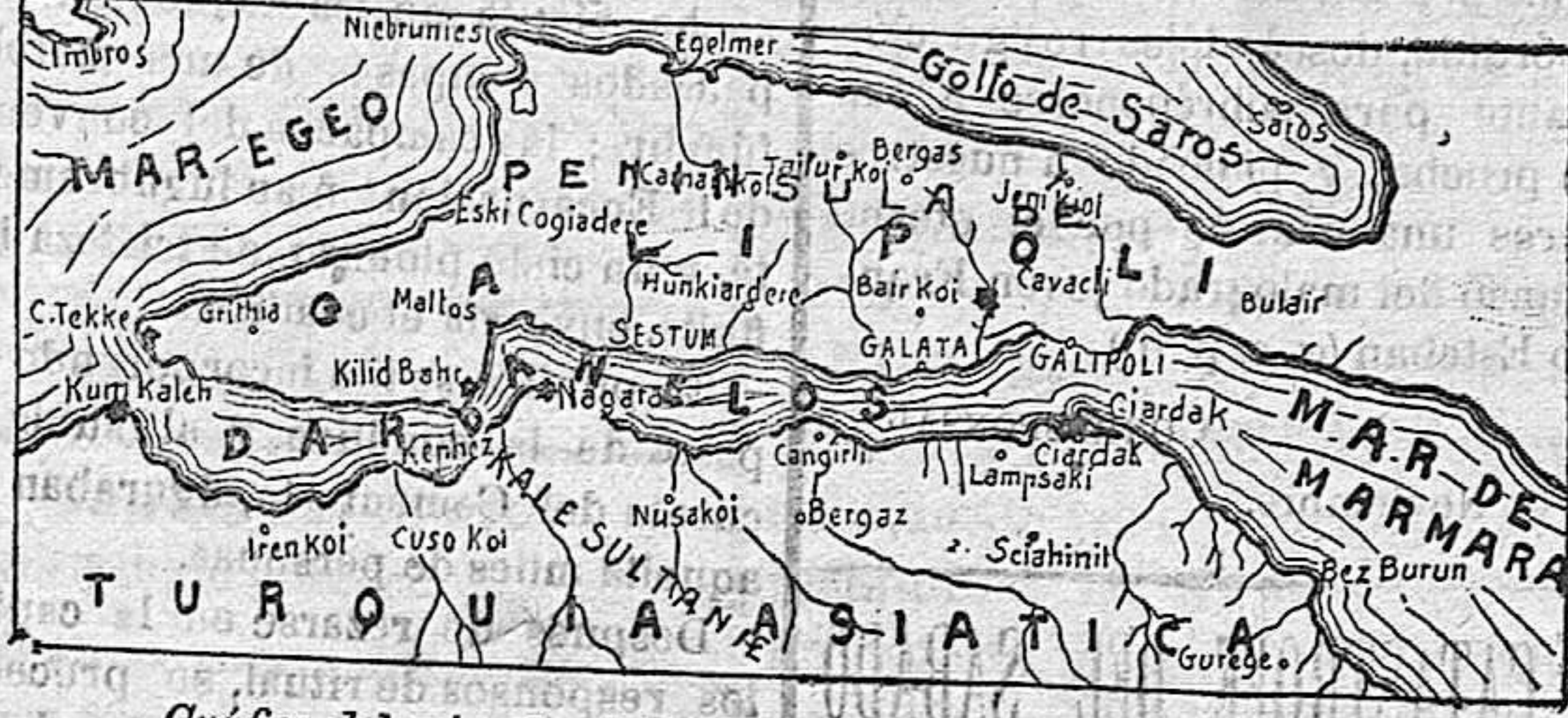
Gráfico del estrecho de los Dardanelos y sus fortificaciones.

Santander a Segovia por Burgos, lo intolerable es que mientras se fomenta la producción catalana, no se cuida la Nación de hacer las obras necesarias para regularizar el régimen de las aguas de nuestras montañas.