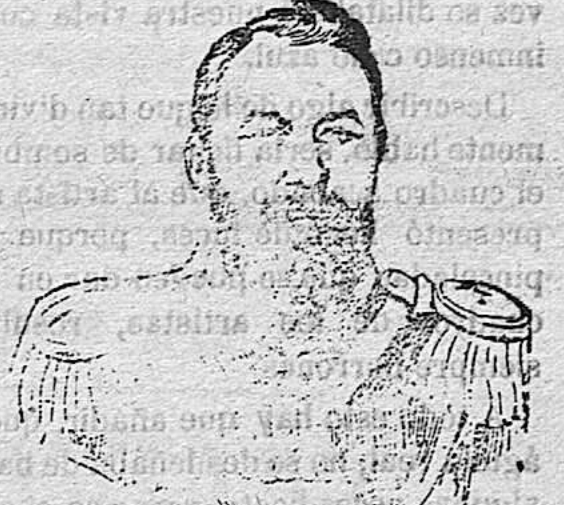
Kuropakine general ruso que mandaba un Cuerpo de ejército en el teatro oriental de la guerra.