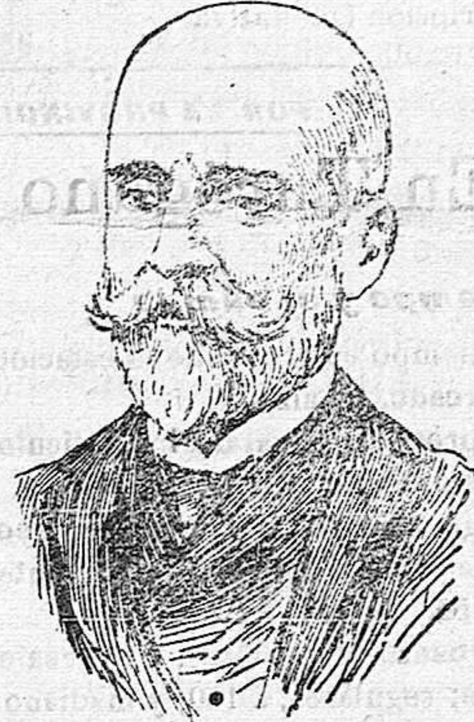
Nuevo presidente de Portugal.