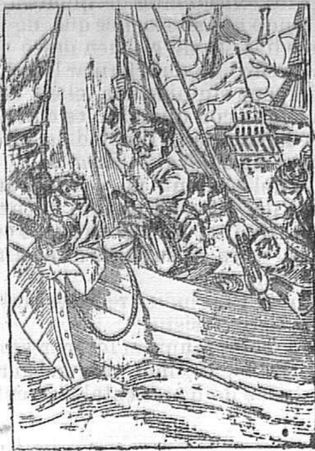
3 de Junio de 1822.