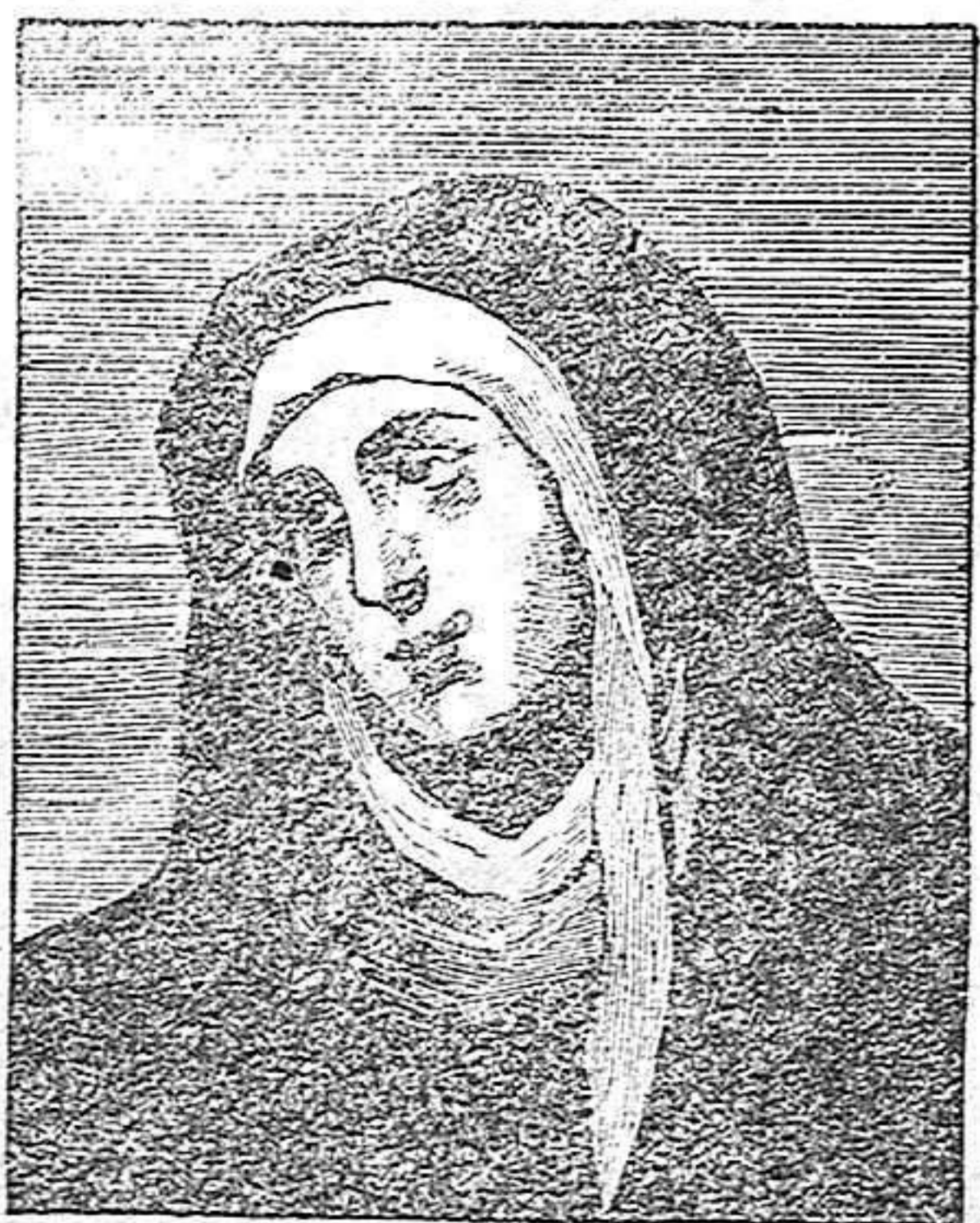
1.º de Enero de 1603 Nace en Sevilla el célebre pintor Bartolomé Esteban Murillo

Bien empezó para España el año de 1603, porque en su primer día vio la luz en la hermosa ciudad que baña el Betis y perfuman los azahares, el más celebrado de nuestros pintores, el orgullo más legítimo, la más preciosa gloria artística de nuestra patria. Quién había de decirle a Bartolomé Esteban Murillo y Pérez, cuando derrotado y miserable, iniciado apenas en el arte de Apelles por su deudo Juan del Castillo, veía deslizarse el tiempo sin poderlo aprovechar por total carencia de medio; quién había de decirle, repetimos, que andando los años su nombre repercutiría por todos los ámbitos del mundo y alcanzaría la inmortalidad sólo accesible a los genios para ella predestinados?