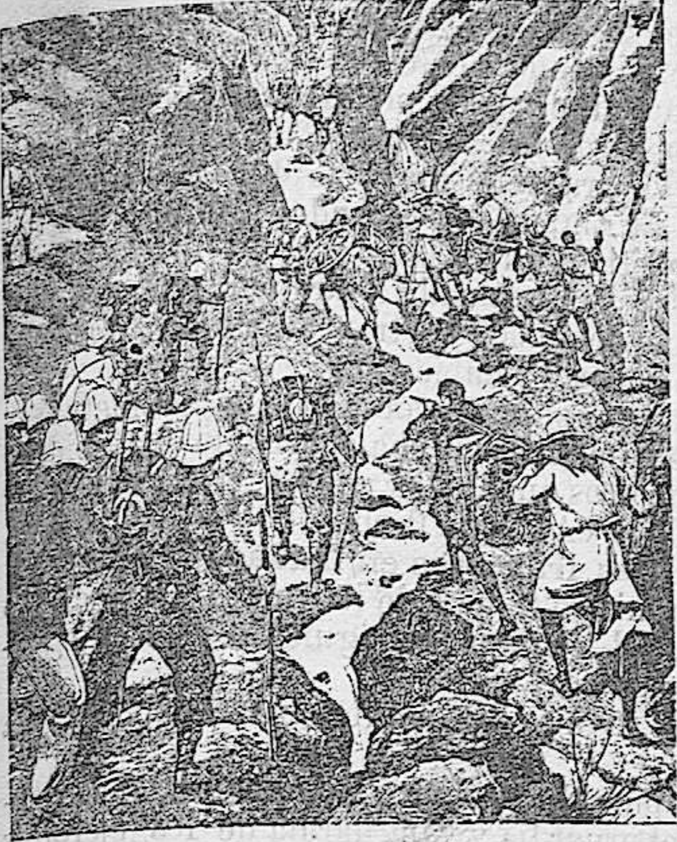
Los franceses en Madagascar

El grabado que ofrecemos hoy á nuestros lectores representa el paso del ejército francés por los desfiladeros de Andriba en dirección á Tananarive. Sábese ya oficialmente que el pabellón francés flota en la residencia de la reina de Madagascar; lo que quizás no se sabe todavía es la suma de esfuerzos á corta de la cual han llegado las tropas del general Duchesne hasta la capital del reino howa. Honor á los valientes soldados! Que el laurel de la victoria alcance á recompensar su esfuerzo heroico, á hacerles olvidar los peligros corridos y á consolarles de las sufridas penas.