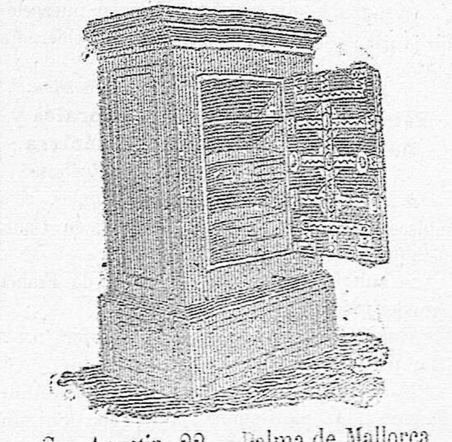
San Agustín, 22.—Palma de Mallorca

Viaje de recreo A LAS MARAVILLOSAS CUEVAS DEL DRACH TÉRMINO DE MANACOR — Ida y vuelta el mismo día. — Precios de entrada á las mismas: De una hasta cinco personas 750 pesetas. Por cada persona de aumento 150. El guía de las Cuevas, vive calle de Artá, núm. 31 en Manacor.