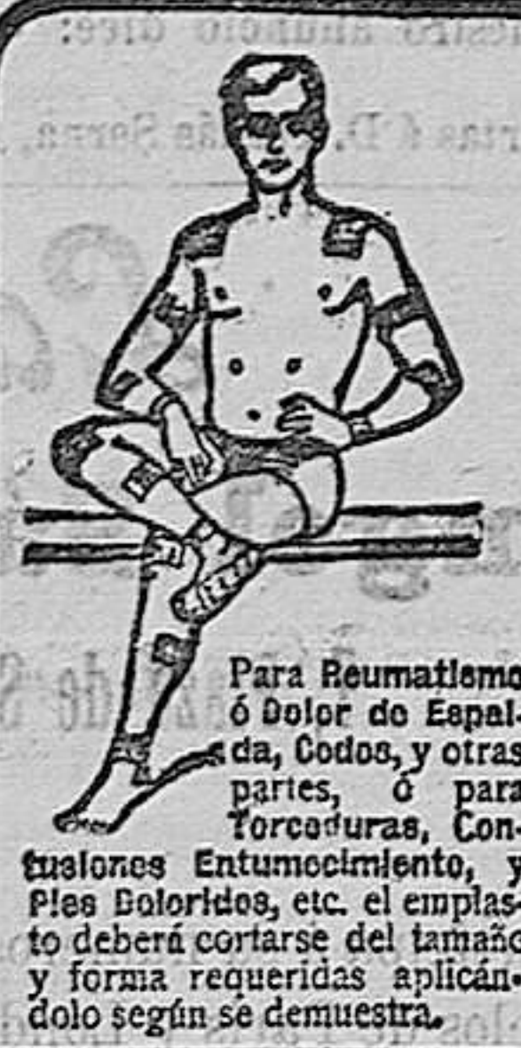
Para Reumatismo ó Dolor de Espalda, Codos, y otras partes, ó para Torceduras, Contusiones Entumecimiento, y Pies Hinchados, etc. el emplastro deberá cortarse del tamaño y forma requeridas aplicándolo según se demuestra.

Donde quiera que se sienta dolor aplíquese un emplastro. Para Reumatismo, Resfriados, Tos, Dolor de Pecho, Debilidad de Caderas, Lumbago, Clática, etc., etc. los emplastos de ALLECOCK son superiores á todos.