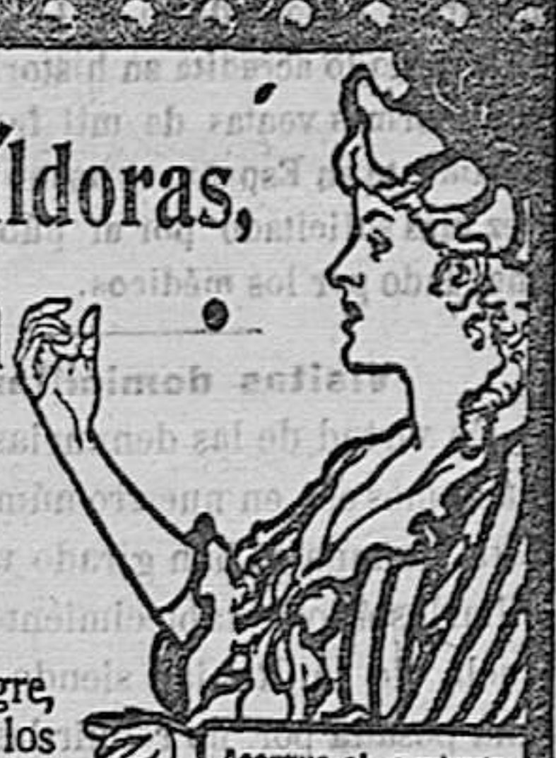
Acerque el grabado á los ojos y verá Vd. la píldora entrar en la boca.