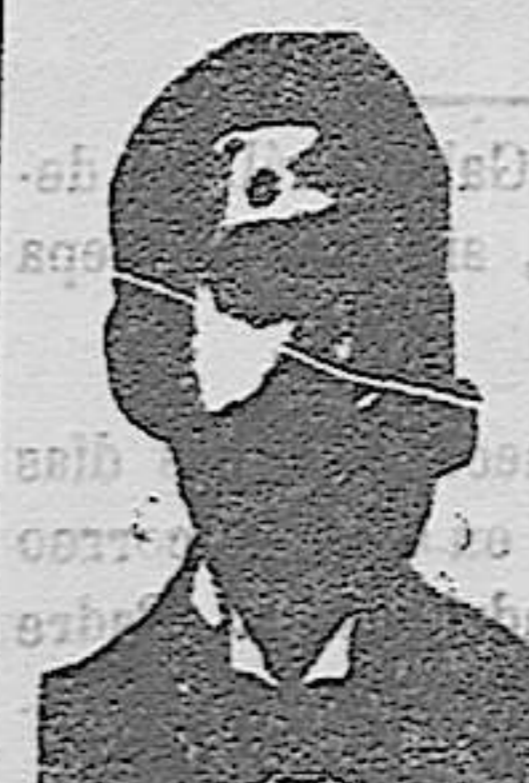
Angelo Costanzi Diputación, 435, et.º Barc.º

Se recomienda el Rocio del Rosal desde la más tierna infancia en competencia con todas las cremas.