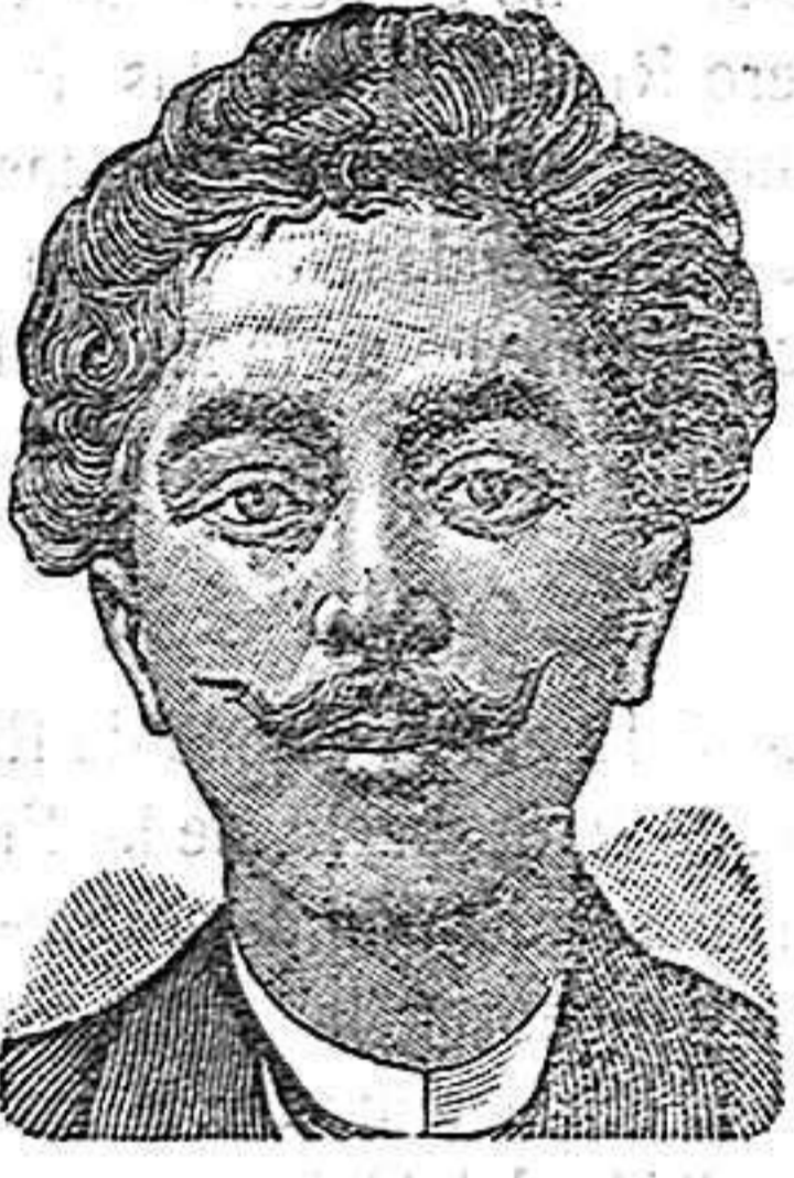
15 días después de tratamiento