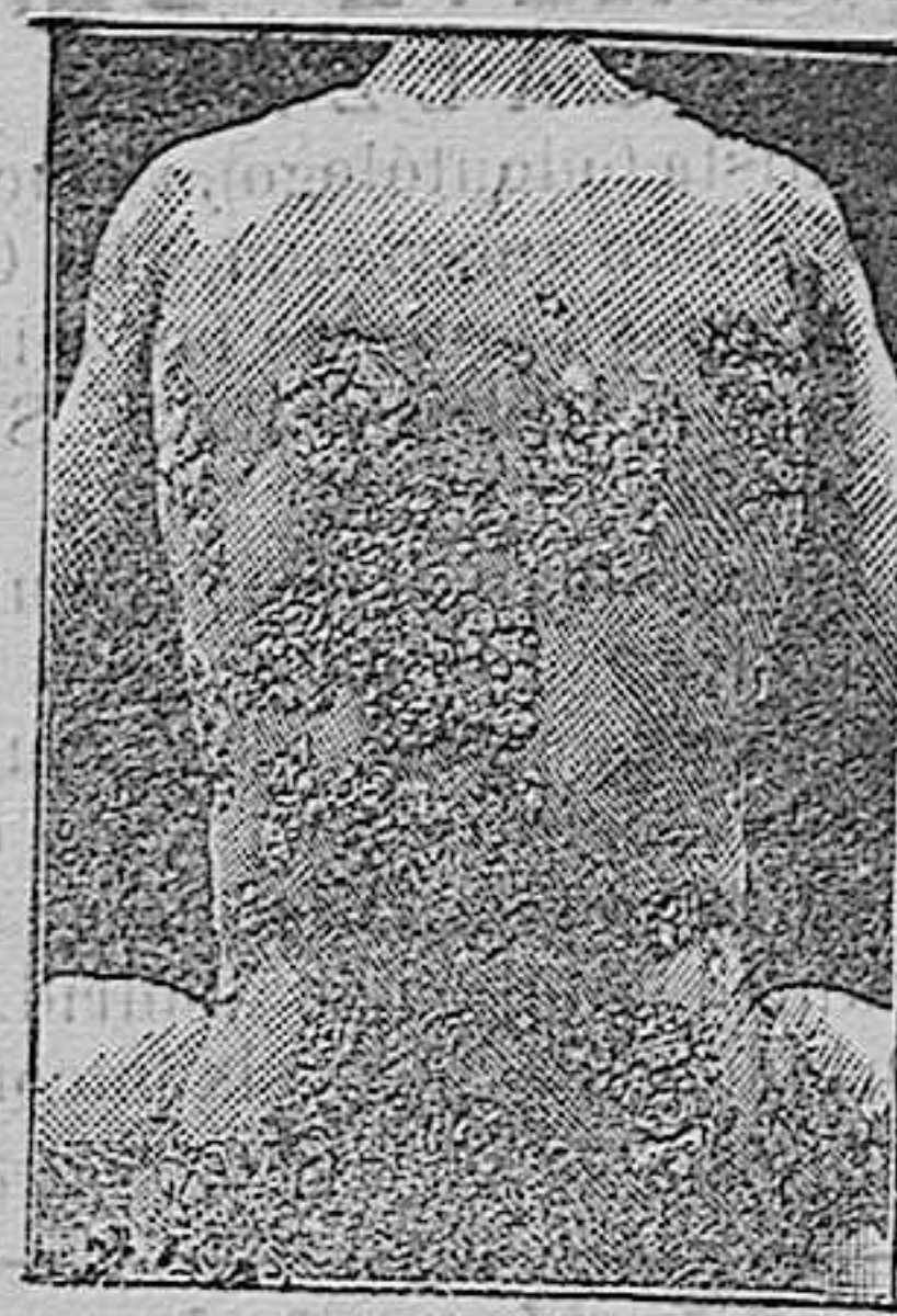
Antes de la curacion