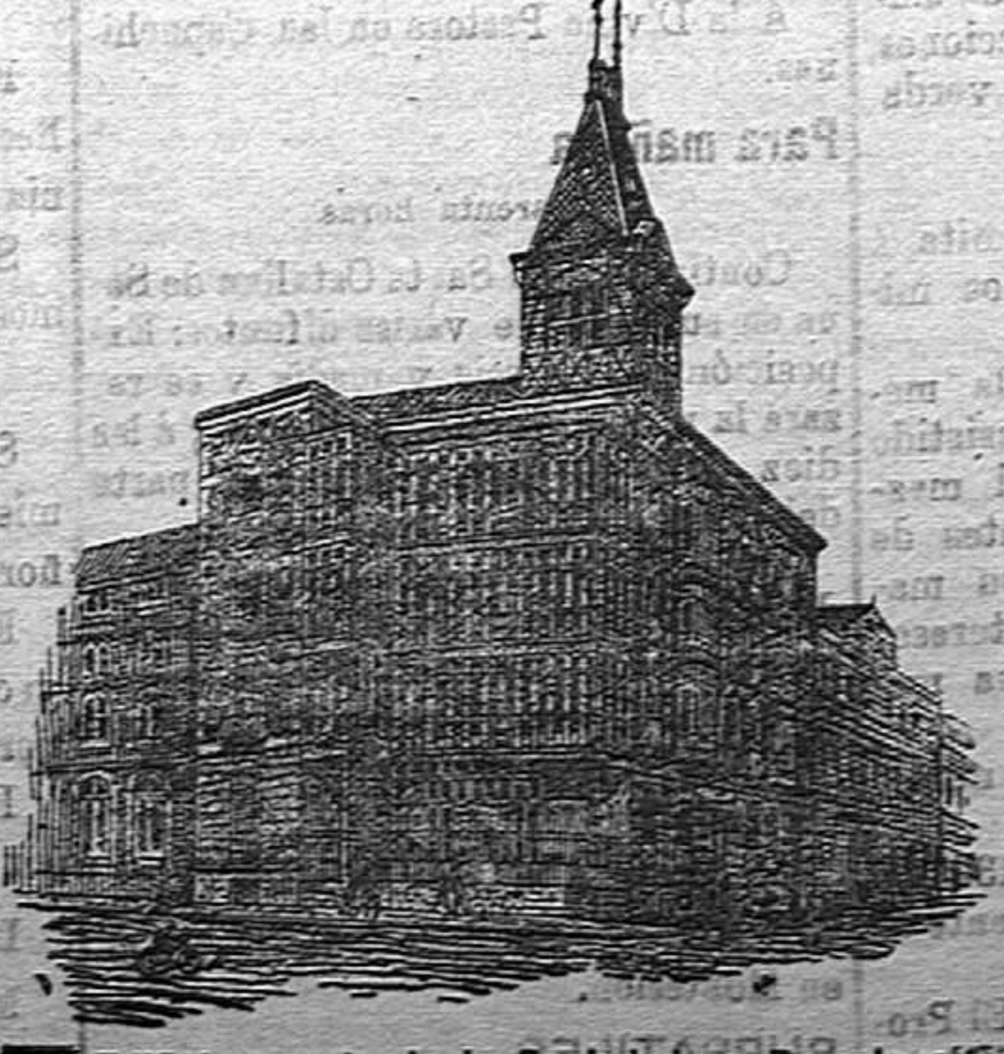
Edificio propio de la Sociedad en Pamplona

Colectores de Cortes para el año 1909. Exp. de Cortes para el año 1909. Imp. de Cortes para el año 1909.