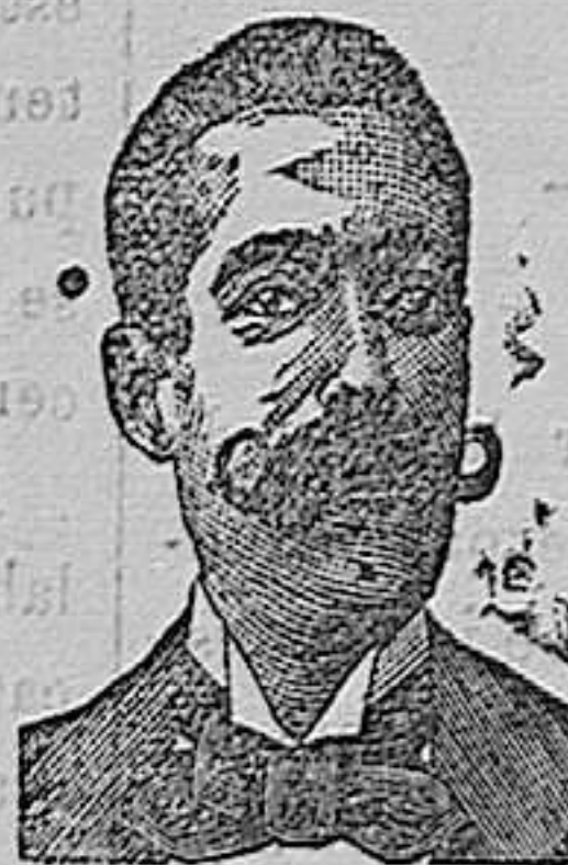
A. SALVATI COSTANZI Calle Diputación, 435, BARCELONA.

Pídanse estos medicamentos en todas las farmacias