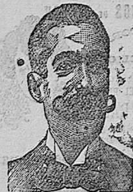
A. SALVATI COSTANZI Calle Diputación, 435 BARCELONA.

O CONFITES ANTIVENÉREOS Y ROOB ANTISIFILITICOS. COSTANZI