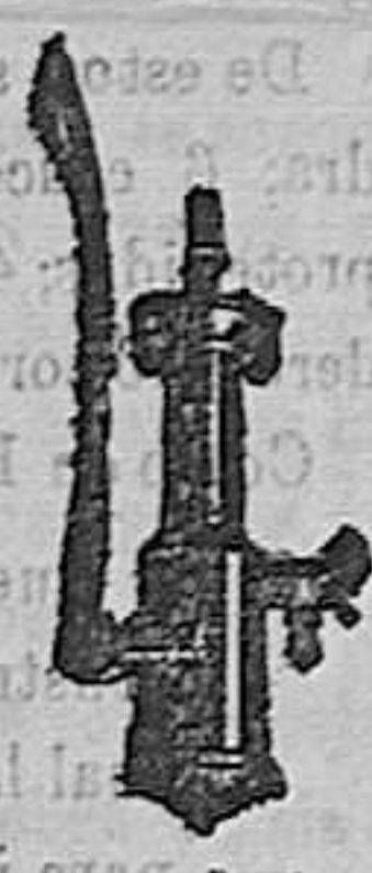
Maquinas de vapor verticales