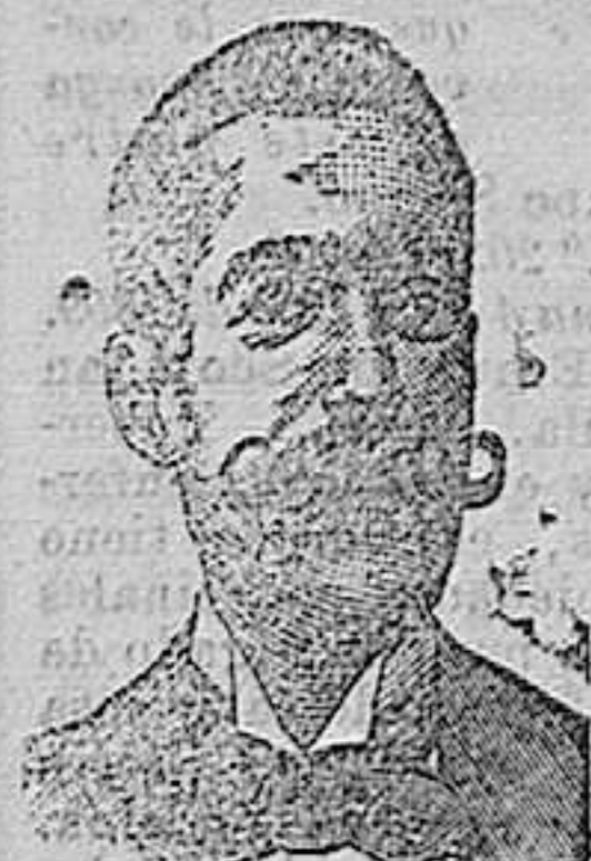
A. SALVATI COSTANZI Calle Diputación, 435 BARCELONA.