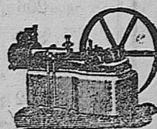
Máquina de vapor Horizontal.