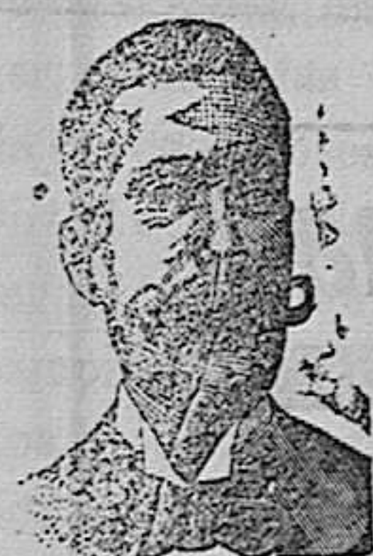
A. SALVATI COSTANZI Calle Diputacion, 435 BARCELONA.

O CONFITES ANTIVENÉREOS Y ROOB ANTISIFILITICOS COSTANZI