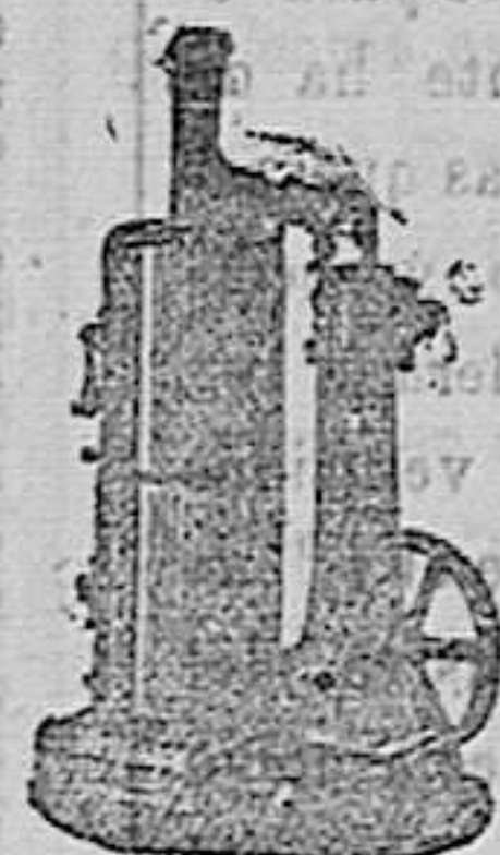
maquinas d vapor vertica