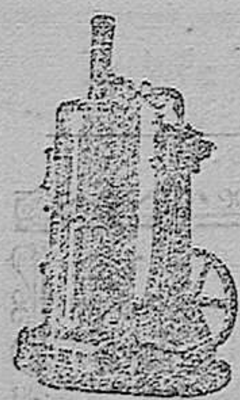
maquina de vapor vertical

Maquinas de vapor, Bombas, Prensas, Tubos de todas clases