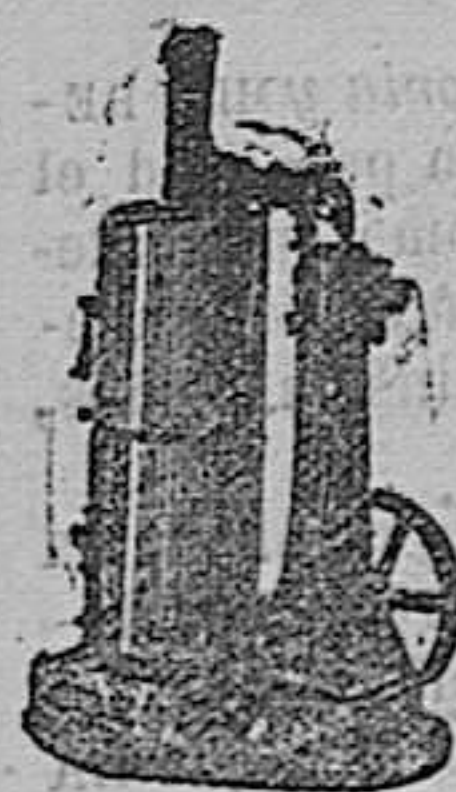
maquina de vapor vertical

Maquinas de vapor, Bombas, Prensas, Tubos de todas clases