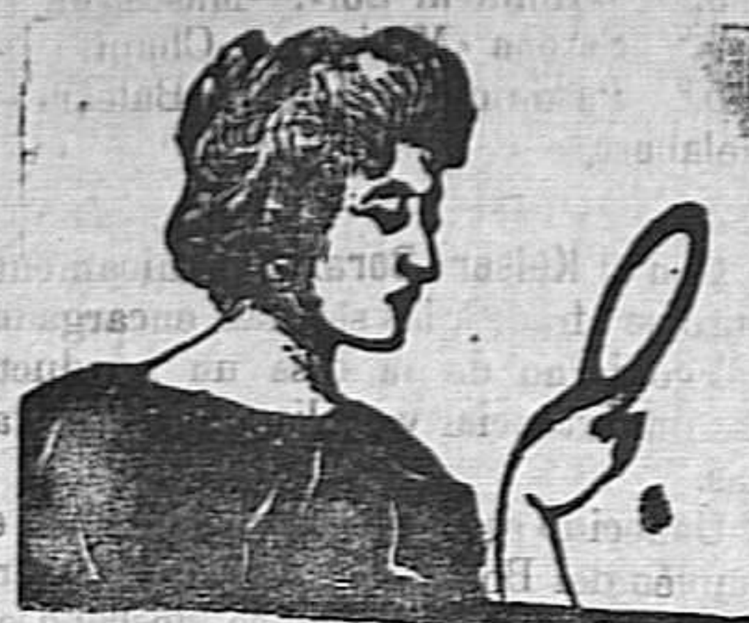
Lavándose con Jabón Gorgot