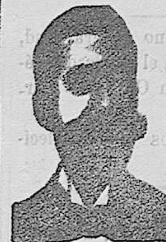
Angelo Costanzi Diputación, 435, et.ª Barr.ª

Nos permitimos recomendar este acreditado preparado a las personas que padecen debilidad en cualquiera de sus manifestaciones y especialmente a las madres cuidadas de sus hijos en el periodo del desarrollo. Es superior y más barato que el aceite de hígado de bacalao y emulsiones.