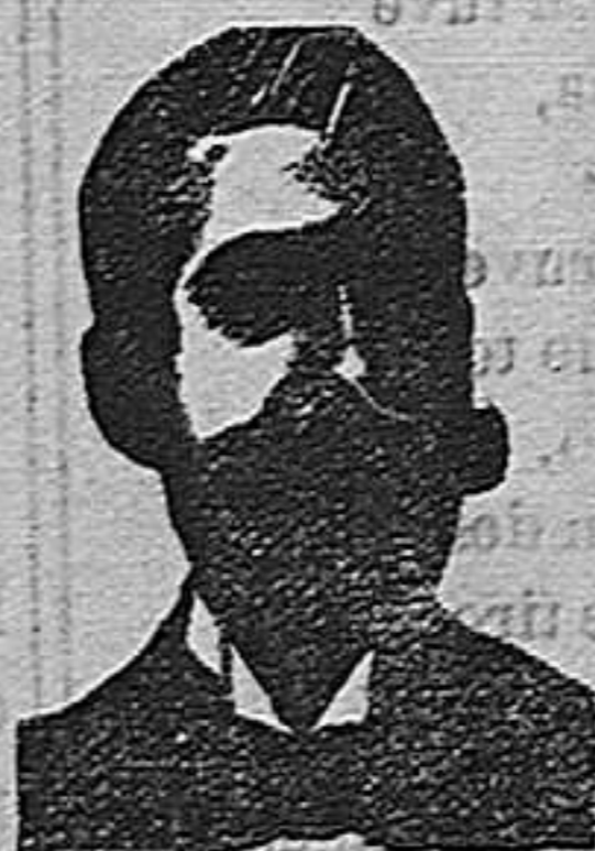
Angelo Costanzi Diputación, 435, et. "Barc."

PARIS, 8, rue Vivienne, y en todas las Farmacias.