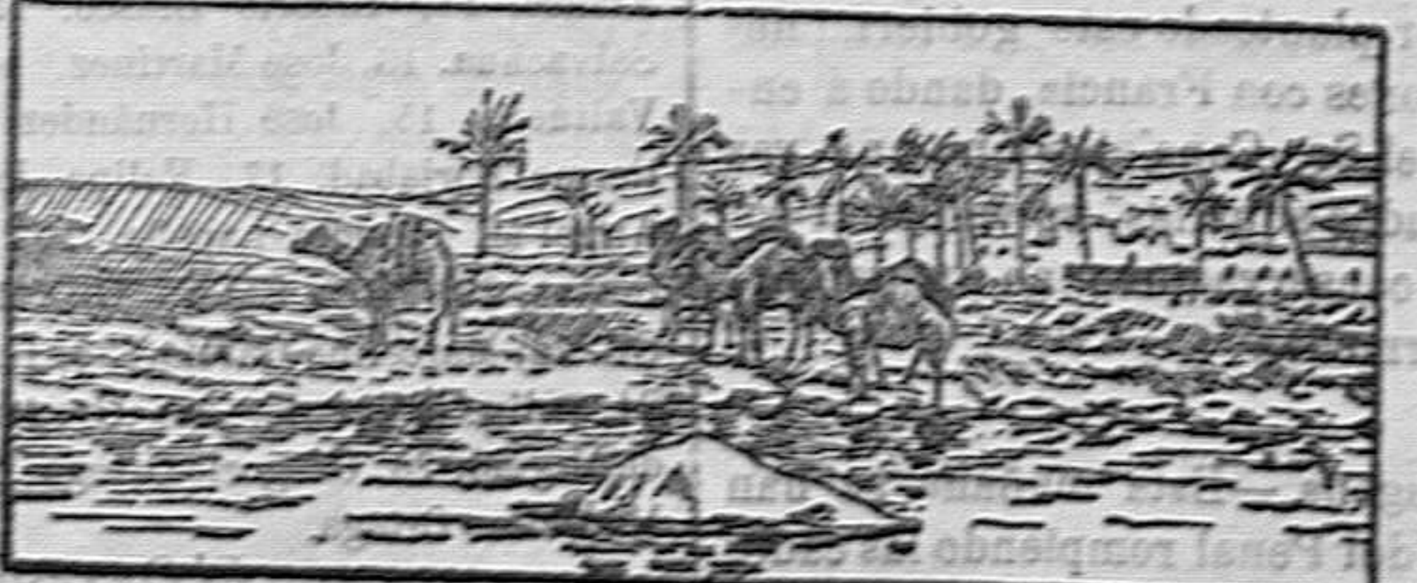
PLAYA DE BENGALI