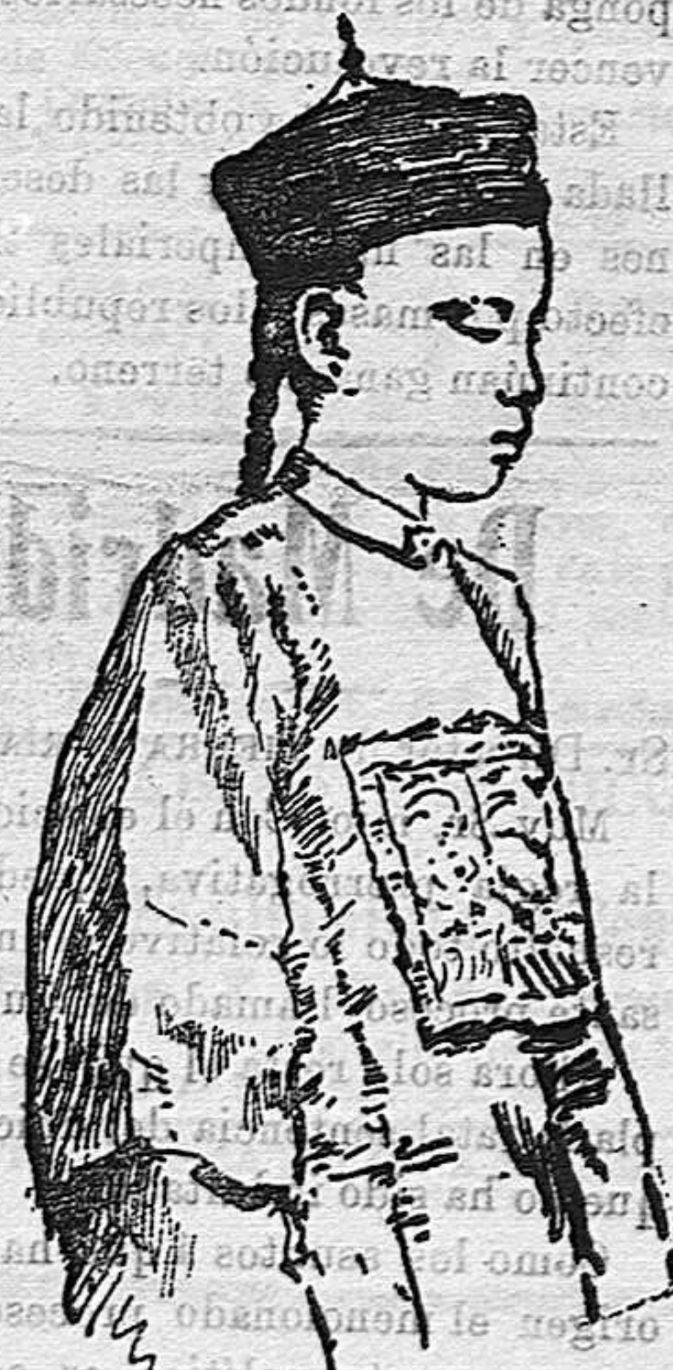
El emperador de la China.

La suerte de la dinastía mandche puede darse por decidida, y no pre- cisamente por que los progresos que