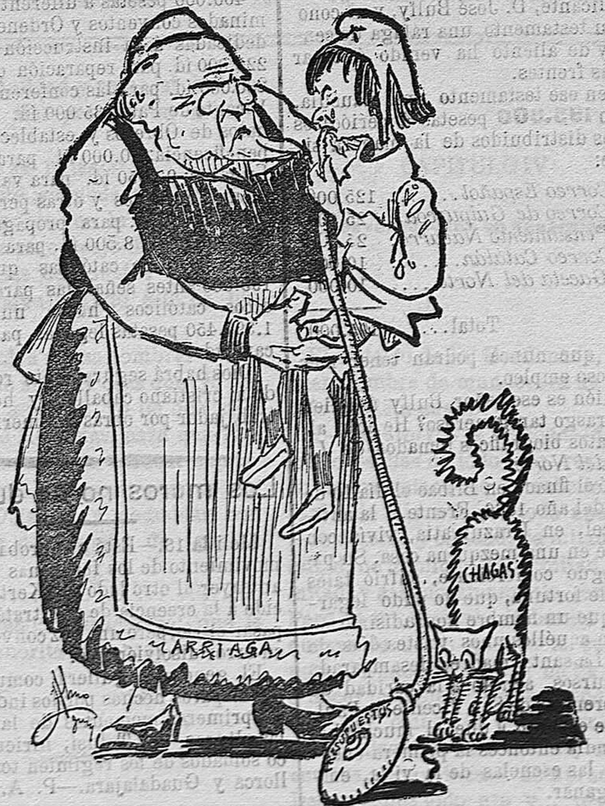
Arrisga.—Pero... no llores hija. ¿Aun te parece poco ese biberón? La pequeña.—Es que me ha asustado el gato...