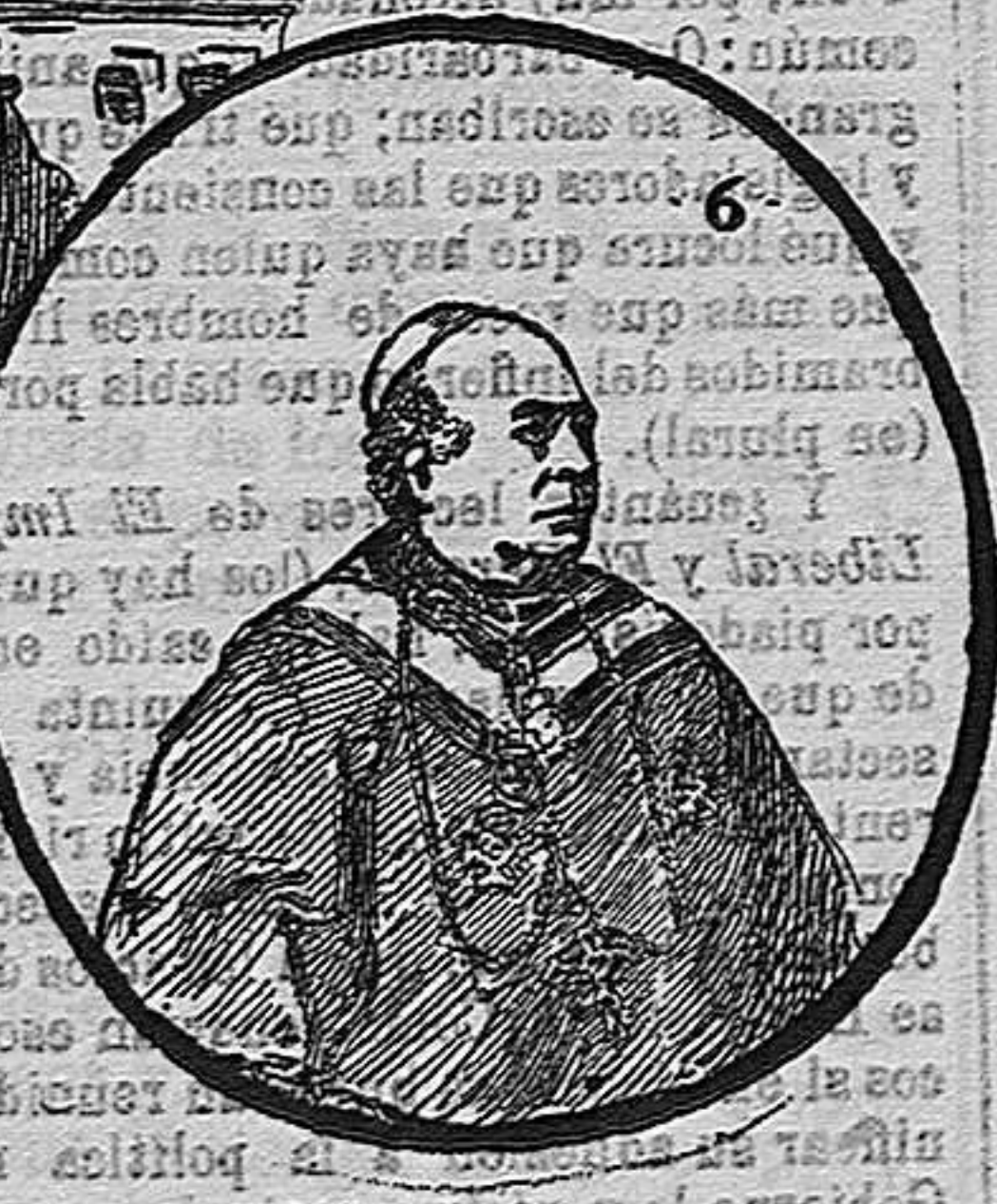
Número 1, Obispo de Madrid. — 2, Arzobispo de Sevilla. — 3, Obispo de Sió. — 4, Obispo de Pamplona. 5, Fachada de la Iglesia de San Francisco el Grande. — 6, Obispo de San Luis de Potosí.

Teresa de Jesús la patria del beato Juan de Ribera y de la Vizcondesa de Jorbalán, apóstoles todos de la devoción al Sacramento, la España que en Lugo y en León, en Alcalá y en Valencia en Daroca y en todas partes tiene pruebas incontestables de que es la nación de Jesús Sacramentado.