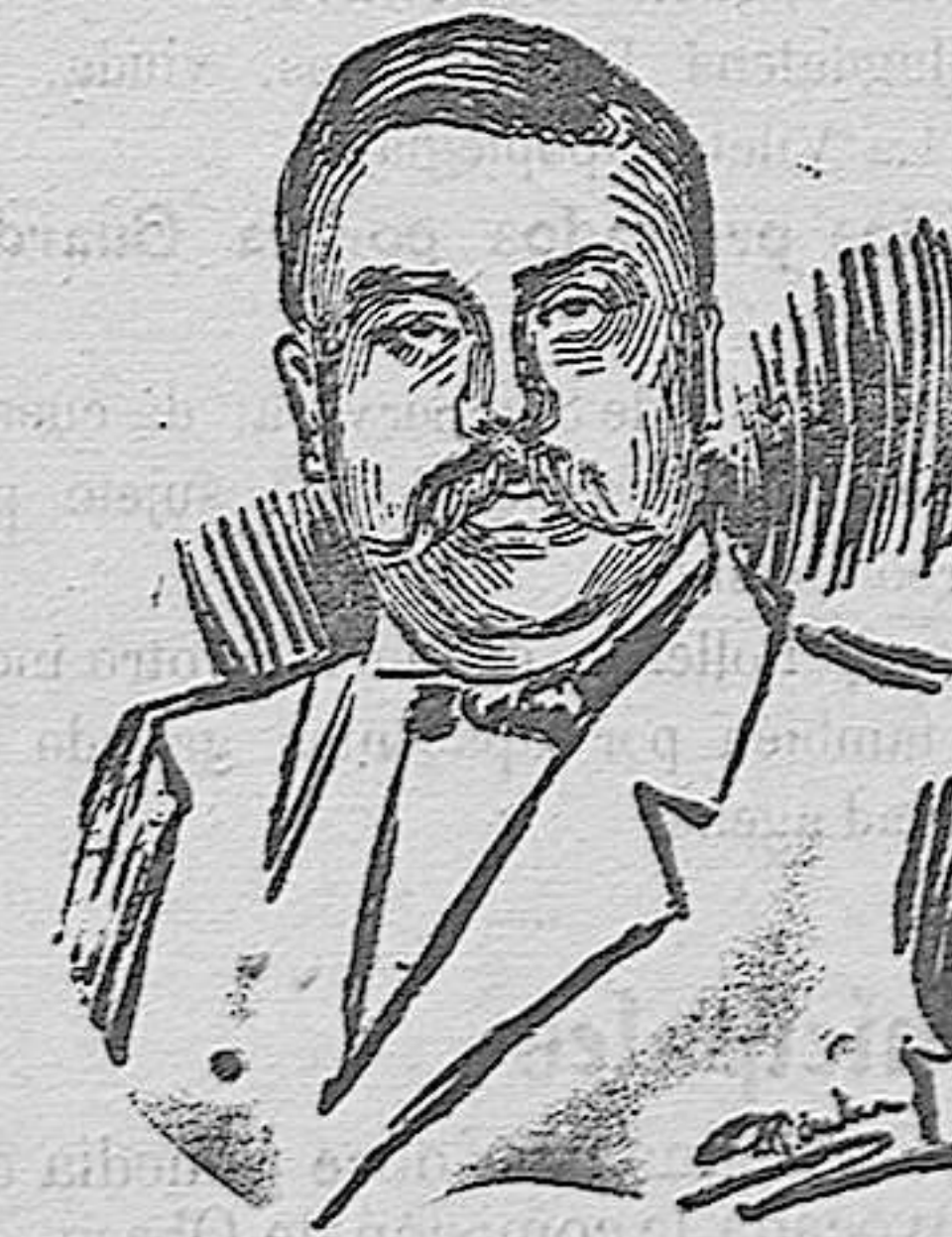
D. Raimundo Fernández Villaverde