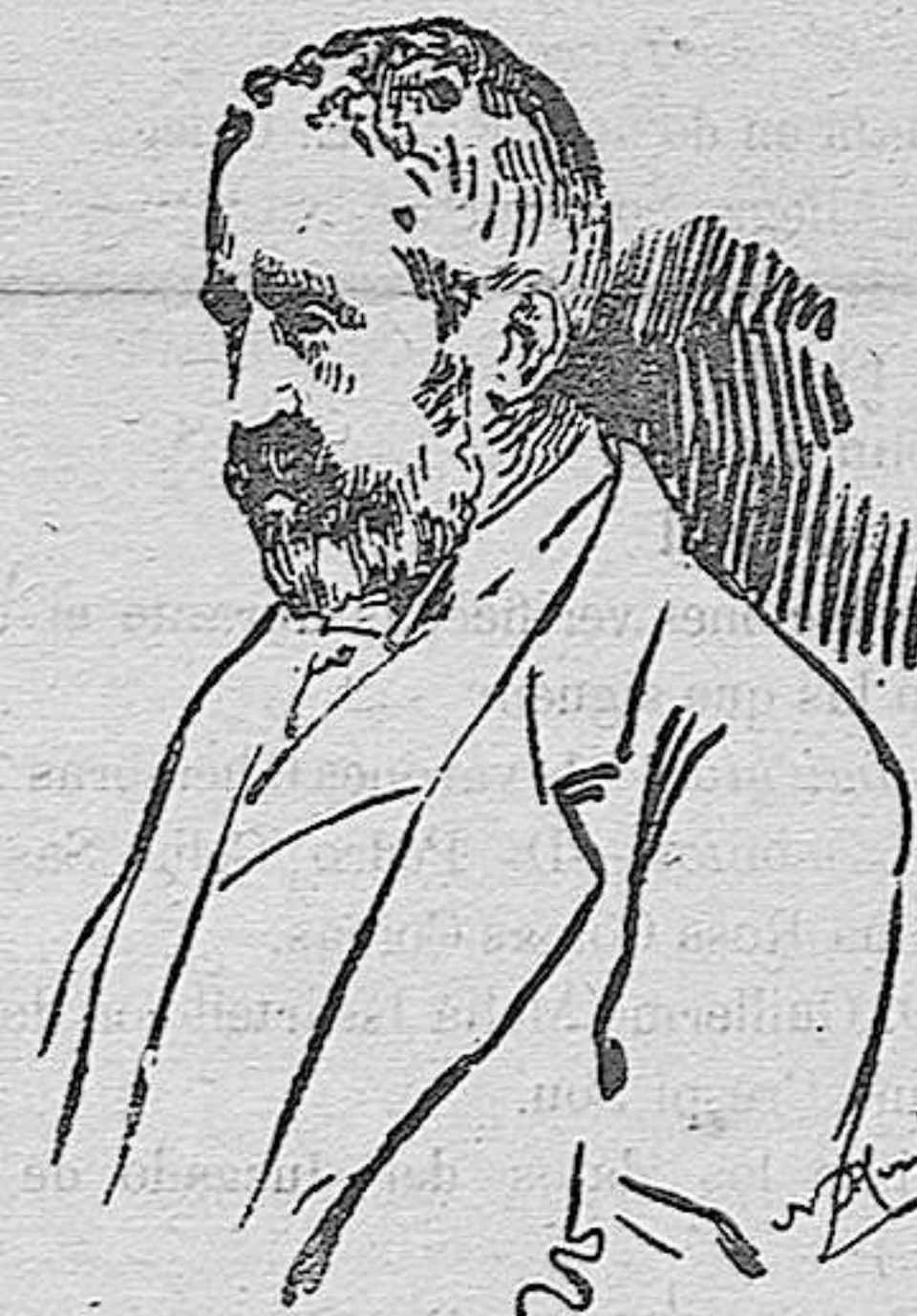
D. Francisco Romero Robledo