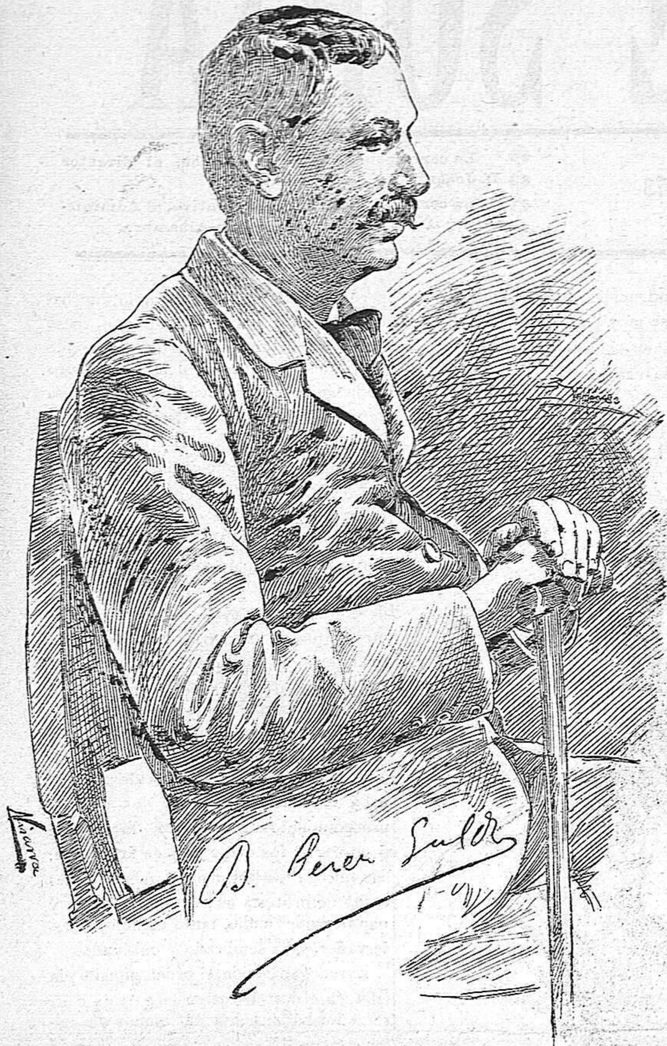
El egregio literato, el sin par novelista de nuestros días, el culto dramaturgo, el buen burgués de la Moncloa, aparece hoy honrando nuestras columnas. Saludándole en ellas respetuosamente, la Redacción de nuestro periódico se complace en enviar el más sincero testimonio de su cariño entusiasta al que es gloria de la España contemporánea.