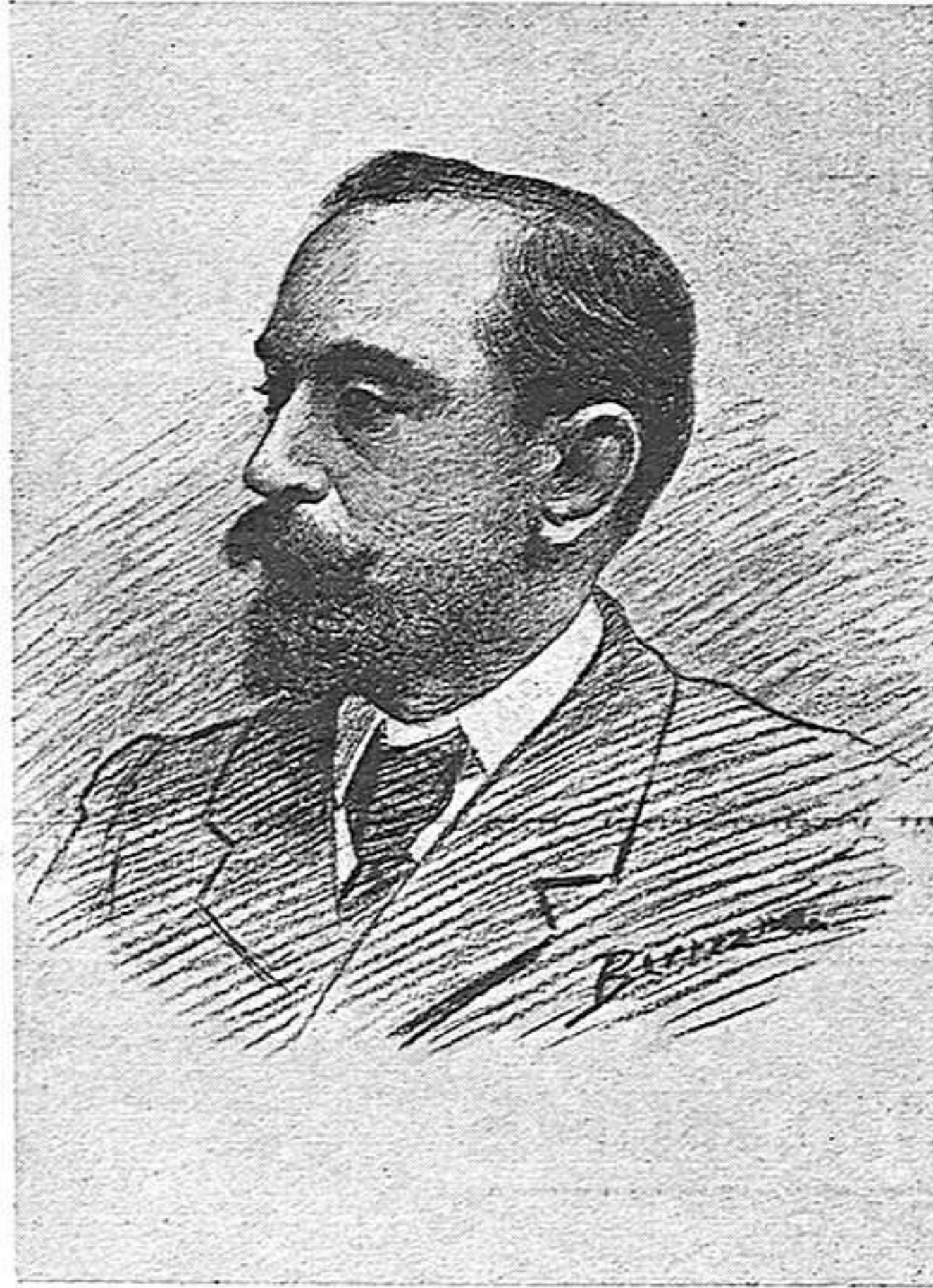
EN JOAN MARAGALL PRESIDENT DEL JURAT CALIFICADOR

—Oh! perdoneu, teniu raó—jo ls respondria—encara som massa semblants pera que jo pugua mo-