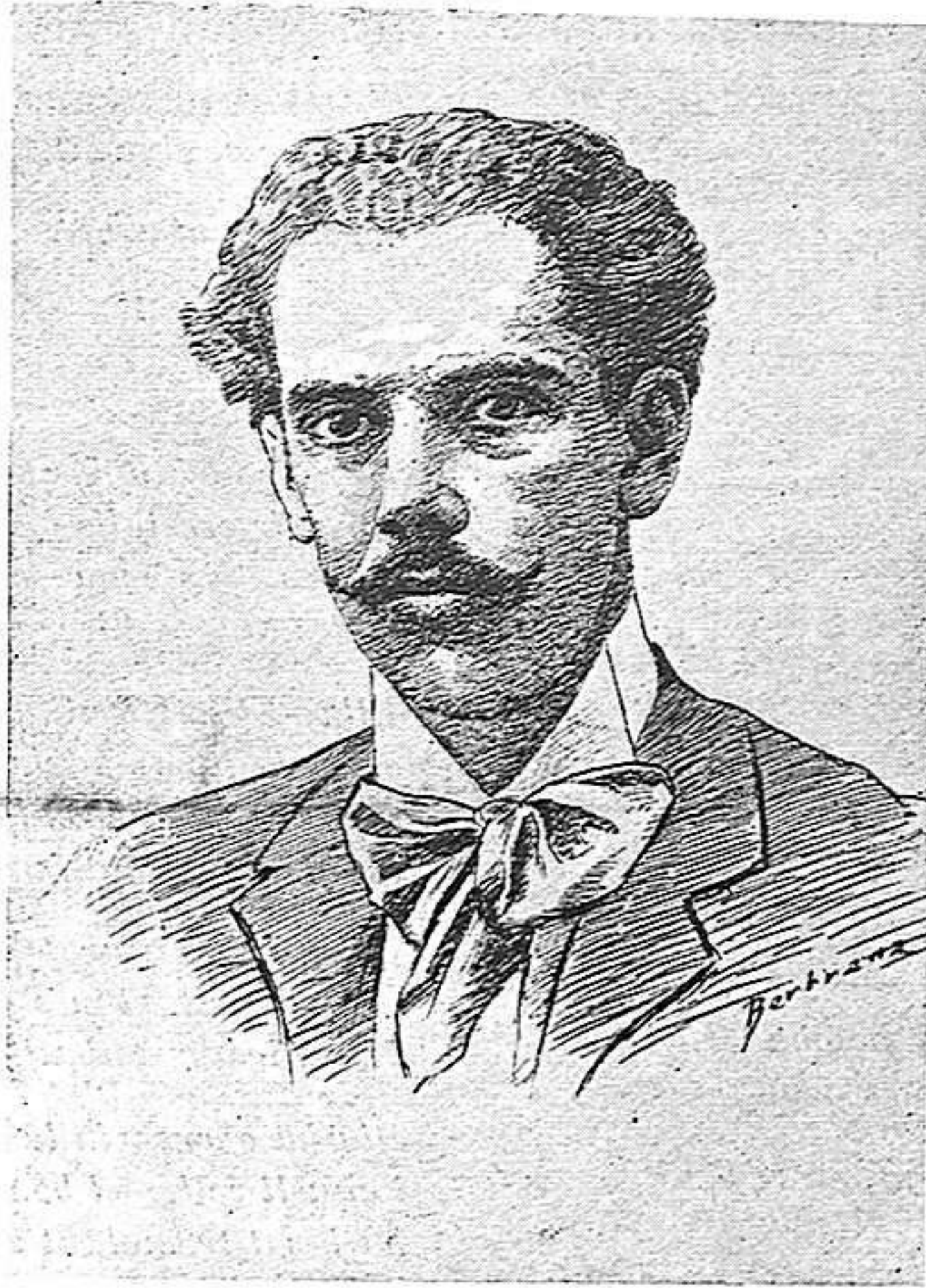
EN PRUDENCI BERTRANA

Amagát entre esquerdots i ortigues, deforme, contorsionat, infecte, restá el cadavre de la Fineta. I l'aigua que gitava la gárgola quimerica caigué com baptisme purificador sobre sa nuesa.