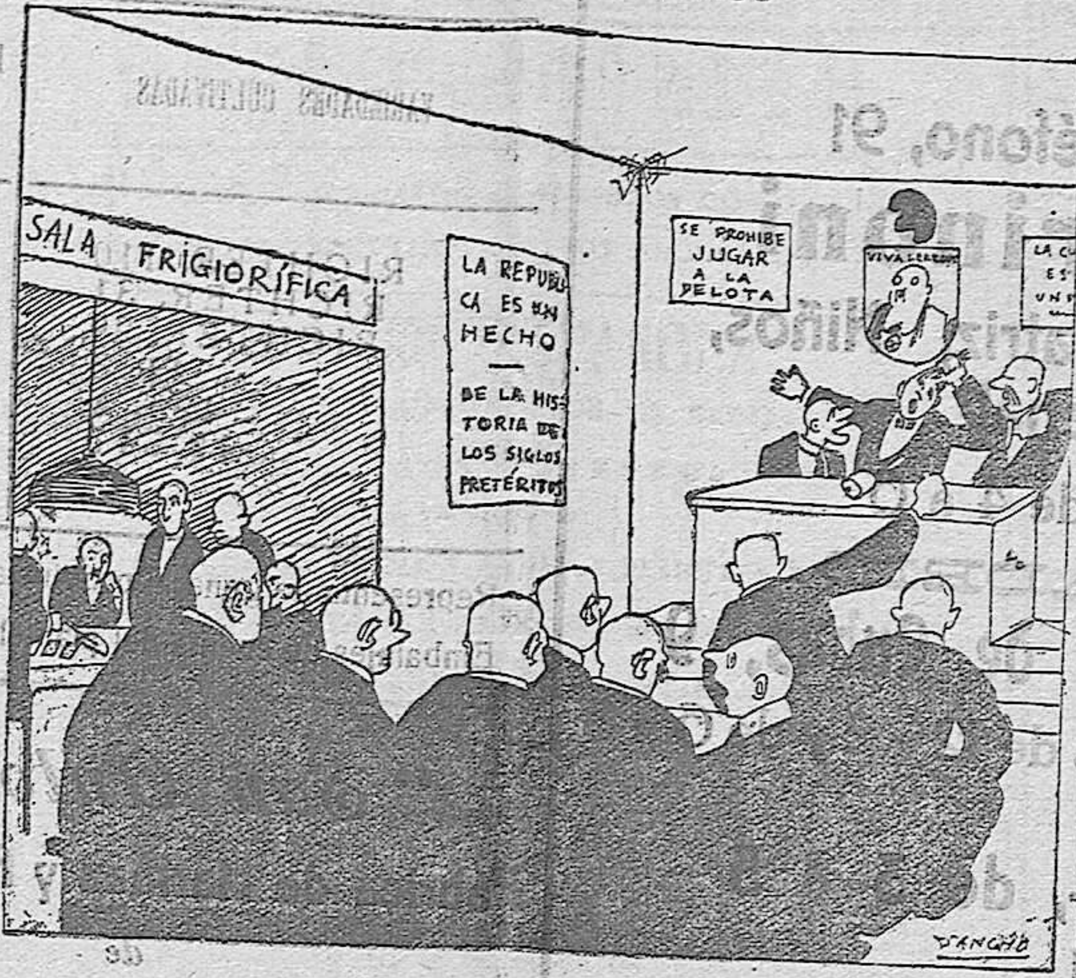
Eduquemos al pueblo