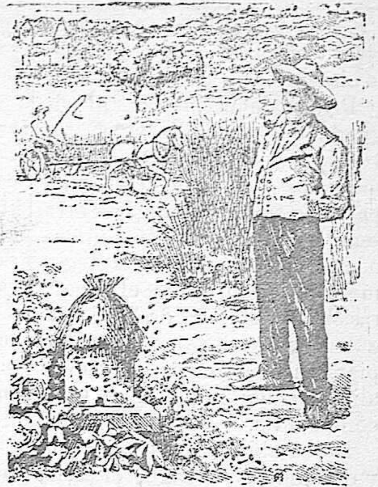
Agricultor moderno que se instruye