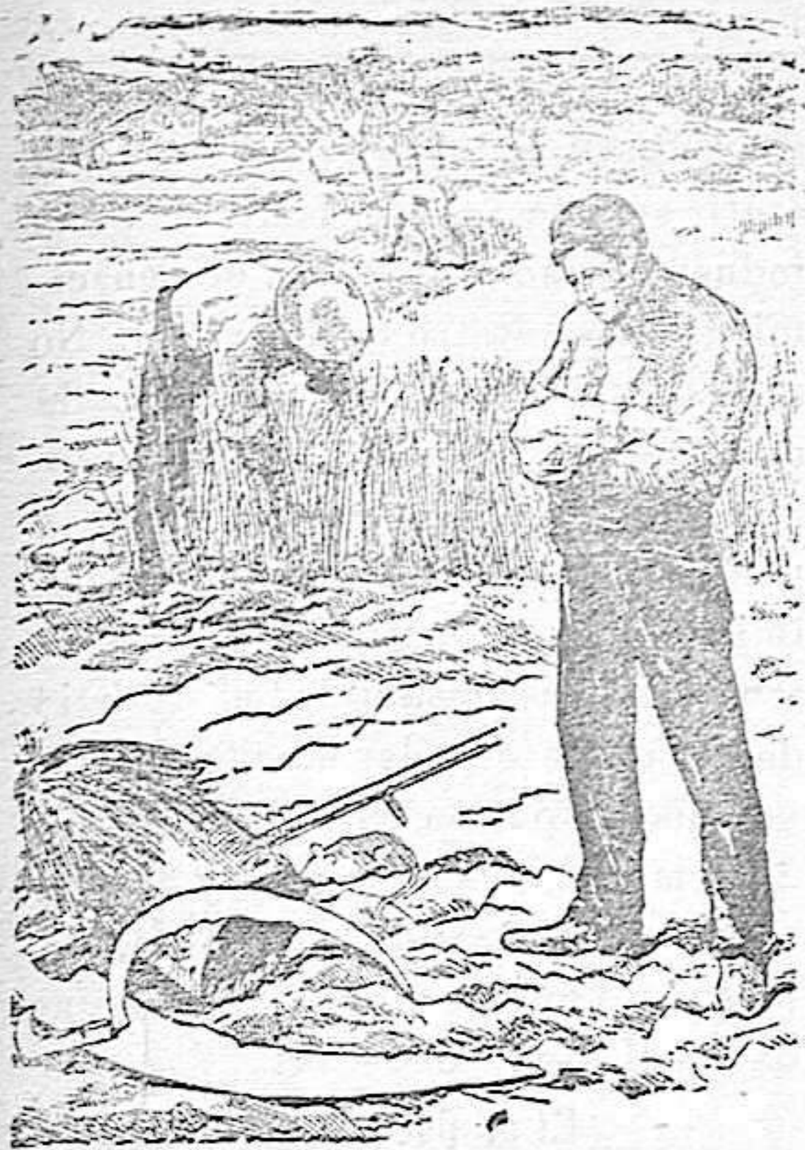
Agricultor rutinario que no lee