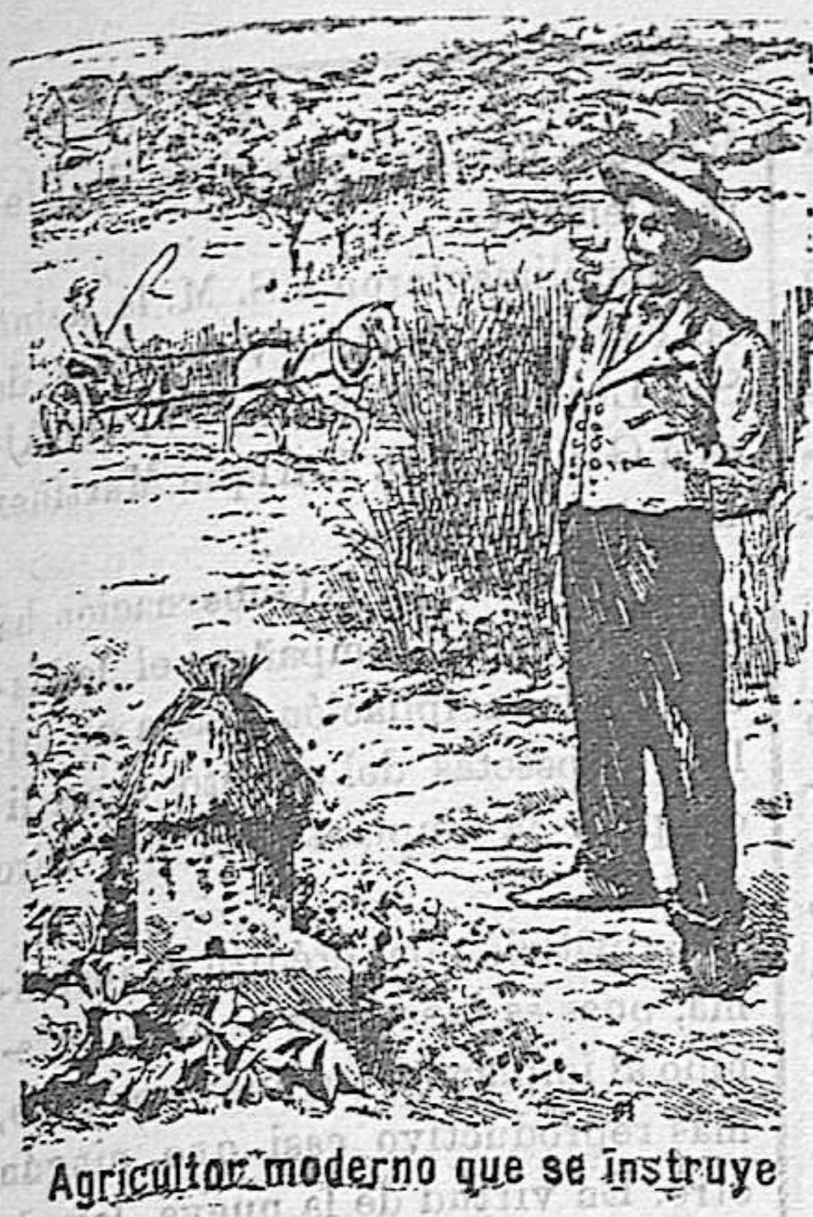
Agricultor moderno que se instruye