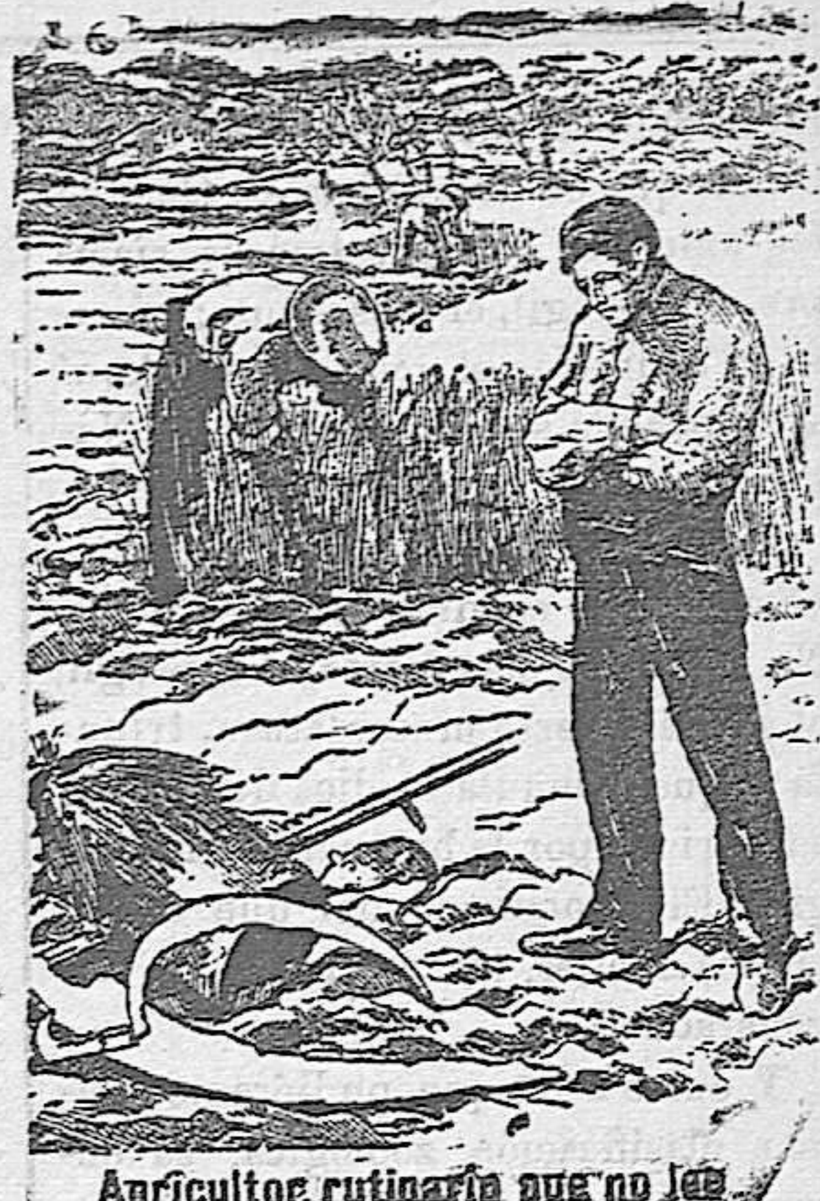
Agricultor rutinario que no lee