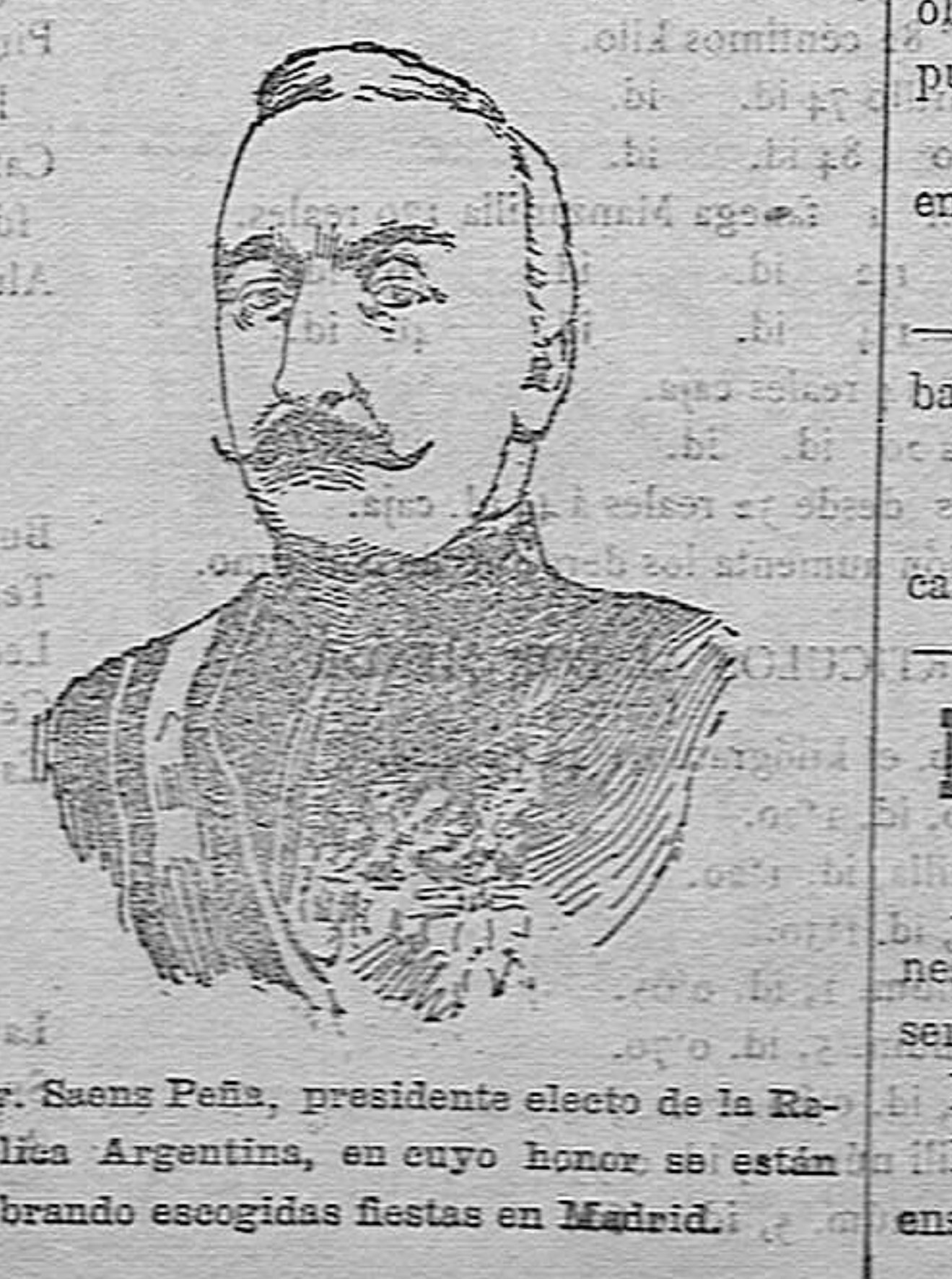
Sr. Saenz Peña, presidente electo de la República Argentina, en cuyo honor se están celebrando escogidas fiestas en Madrid.

Nuestros suscriptores, como oportu- namente se les prometió, recibirán sin aumento de precio, dichos extraordinarios.