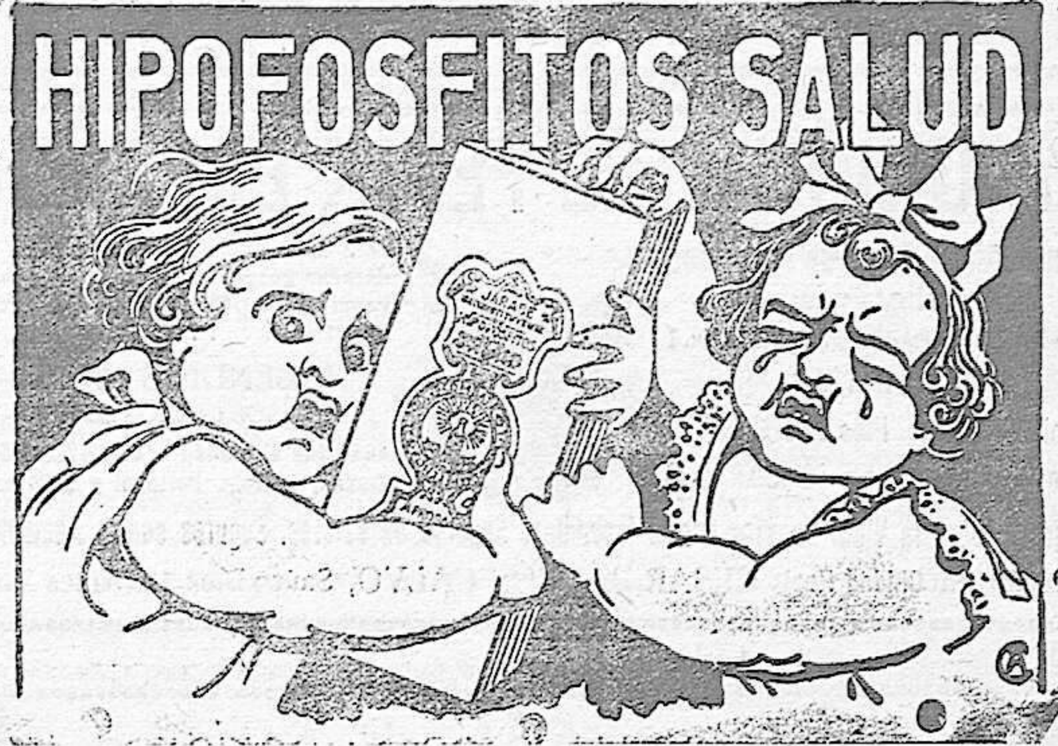
LA SALVACION DE LOS NIÑOS

enfermizas y de naturaleza débil está en este poderoso reconstituyente. Les combate eficazmente la INAPETENCIA y les enriquece la sangre, haciéndoles crecer sanos y robustos. 30 años de éxitos creciente.