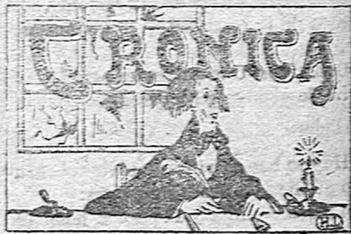
LA VIDA ANECDÓTICA

Igualmente estarán sujetos á tarifa, las noticias de aniversarios, fallecimientos, necrologías, etc., etcétera, que no vayan acompañadas de esquila.