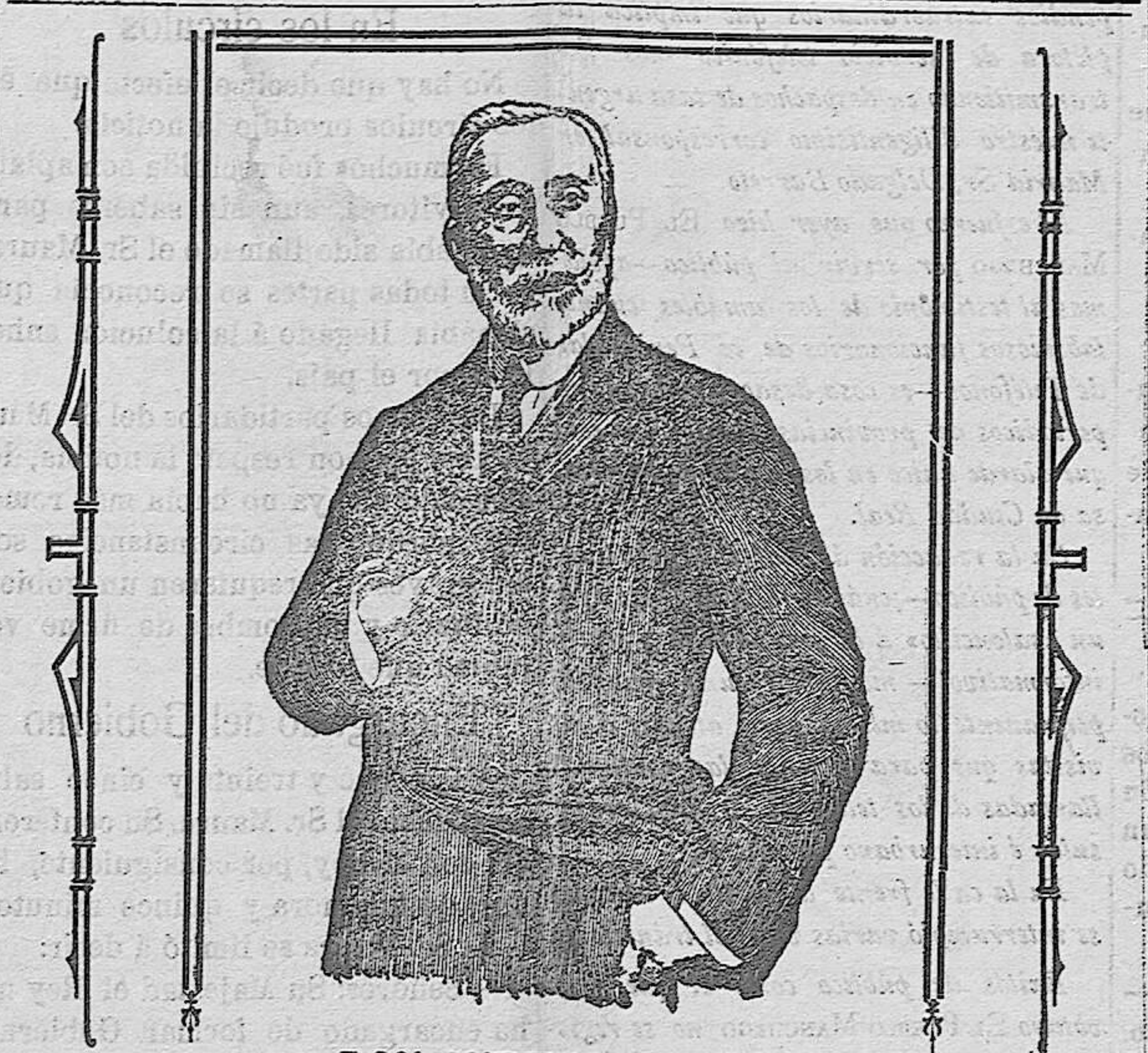
DON ANTONIO MAURA, de la ley un esclavo, de la honradez un sacerdote, á quien las presiones de la Entente, el pandillaje de los viejos partidos y la inconsciencia nacional, impiden ser en estos días de angustia, la salvación de la Patria.

Sabemos que el pueblo gallego, harto de sufrir el oprobioso yugo de los profesionales de la política, prepara, con el creciente poderío de las organizaciones agrarias y con una explosión formidable del odio popular, un despertar nada heroico, si no a los exploradores de aquella hermosa región.