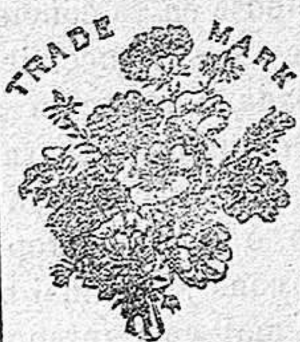
Flor de la Sabana de SEQUAH

Los muchos millares de certificados de personas que deben la curación de sus enfermedades á estos dos preparados y los brillantes elogios de varias corporaciones científicas del mundo entero, son el mejor elogio que pueda darse.