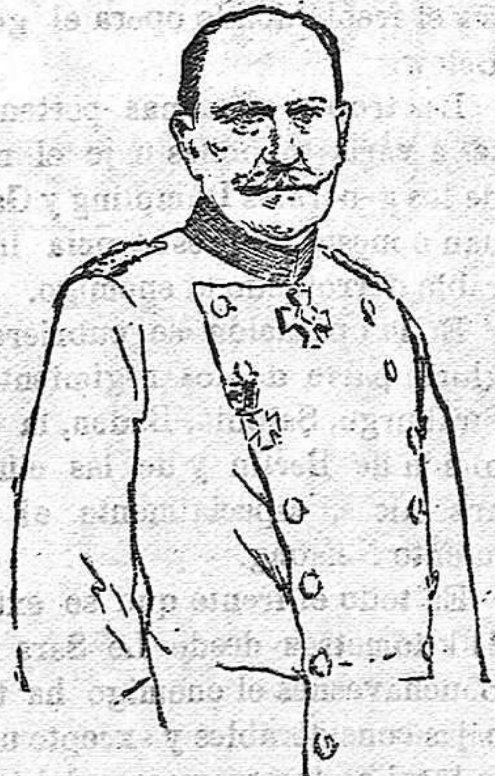
El general Bessler, gobernador de Polonia, que en nombre de los Imperios Centrales proclamó en Varsovia la independencia polaca.

Polonia independiente. Los emperadores de Alemania y Austria han cumplido la palabra que empeñaron al principio de la guerra.