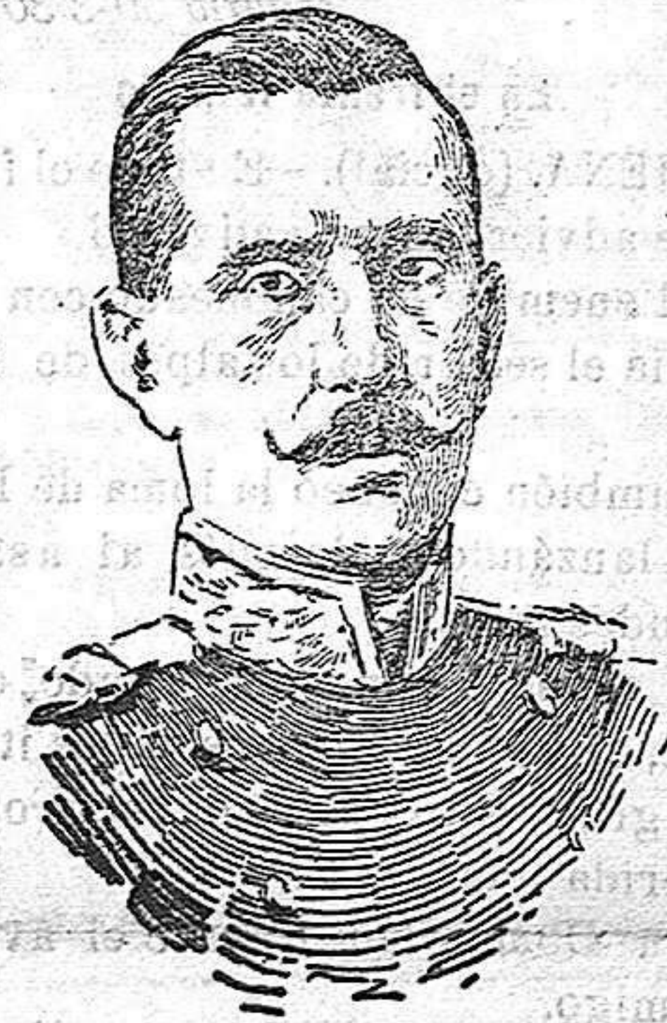
El generalísimo búlgaro Iekov

de los aliados, y mejora de la temperatura en Macedonia, donde los fuertes calores estivales, aparte de lo inadecuado que hacen la estación para grandes operaciones de guerra, ocasionan verdaderas epidemias de paludismo, tifus y disenteria, consagrándose a sus preparativos, y el general Serrail era nombrado comandante en jefe de los ejérci-