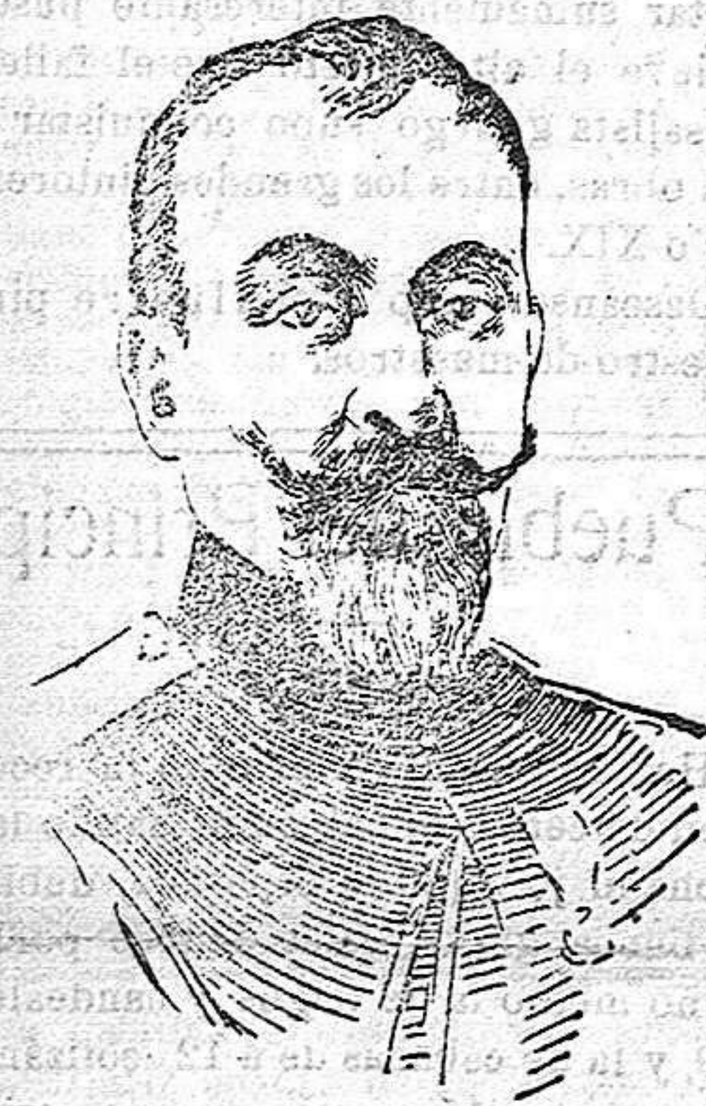
General Boiadref, comandante del primer cuerpo de ejército búlgaro que ocupa Serbia.

Demirhisar y otras poblaciones menos importantes. Posteriormente tomaron posesión de Cavalla, el tan disputado puerto macedónico, verdadera manzana de la discordia entre griegos y búlgaros, y de algunas importantes posicio-