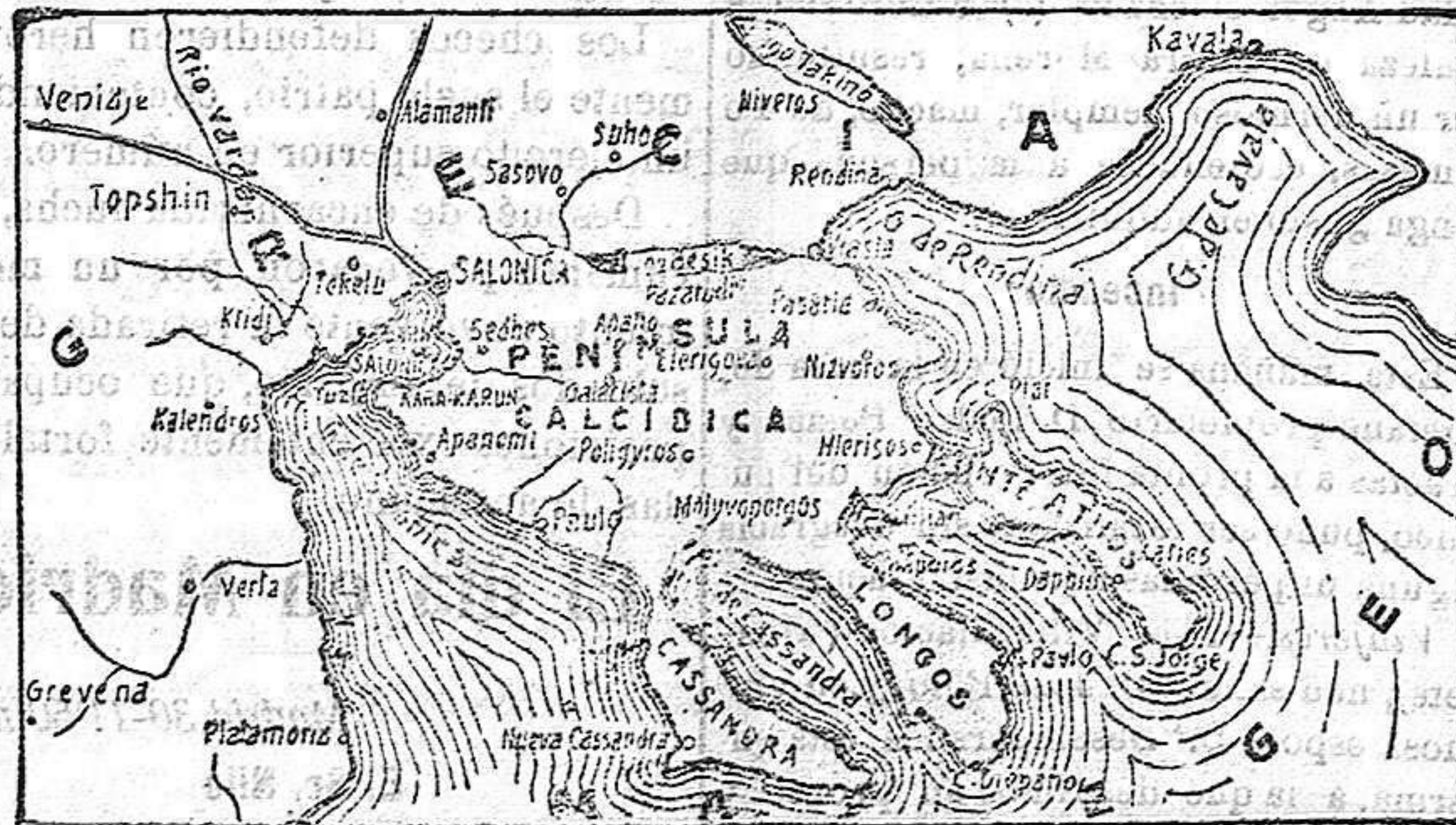
Gráfico del frente balkánico

Demirhisar y otras poblaciones menos importantes. Posteriormente tomaron posesión de Cavalla, el tan disputado puerto macedónico, verdadera manzana de la discordia entre griegos y búlgaros, y de algunas importantes posicio-